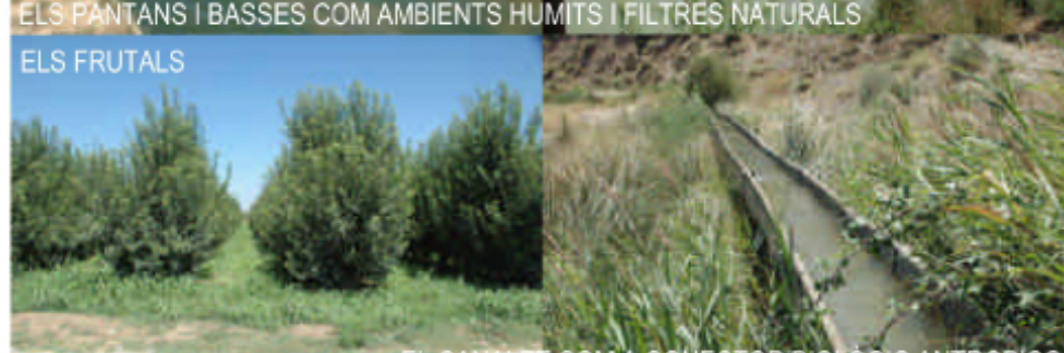
EL CANAL COM A CONECTOR BIOLÒGIC ANTROPIC