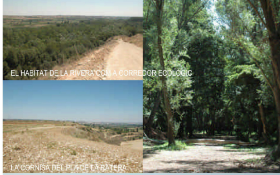
ELS VALORS D'INTERES NATURAL DE LA RIVERA DEL RIU NOGUERA RIBAGORÇANA

Un dels fets singulars del municipi és la indústria tèxtil (filats i teixits) que aprofita el canal de Pinyana, a la vora del qual es formà la colònia de la Mata de Pinyana , que pren les aigües del Noguera Ribagorçana. Aquesta indústria va afavorir el desenvolupament demogràfic i urbà del municipi d'Alguaire i progressivament es convertí en una fita patrimonial indestruïble del paisatge del Segrià . La crisi del tèxtil provocà l'abandonament de les activitats fabrils i d'ençà el 1979 el recinte esdevé un espai obsolet en atesa d'una reactivació econòmica i funcional .