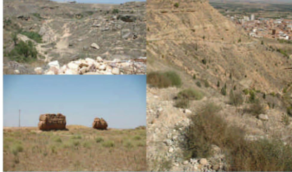
EL PAISATGE DELS CULTIUS TRADICIONALS DE LA REGIONS ESTEPIQUES