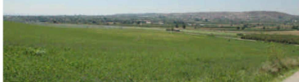
ELS VALORS DEL PAISATGE AGRARI COM A ESENCIA DEL APISATGE DE LA COMARCA