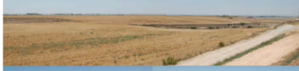
EL NOU PAISATGE AGRARI COM A RESULTAT DE LA GESTIÓ DELS RECURSOS HIDRÍCS