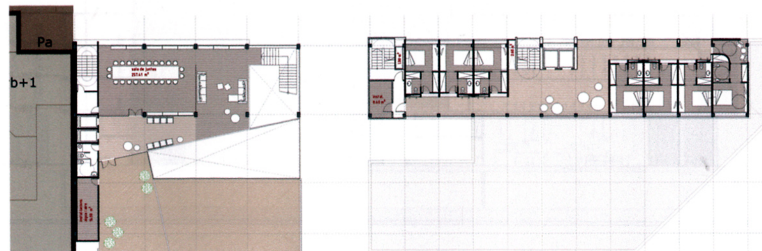
PLANTA CINQUENA_Sala de juntes i torre d'hotel e:1/200