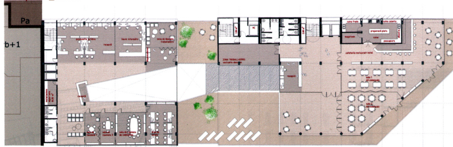
PLANTA TERCERA_restaurant de l'hotel e:1/200