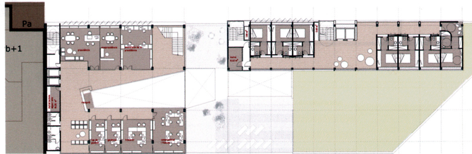
PLANTA CUARTA_Cúpula presidencial i inici de la torre d'habitacions e:1/200