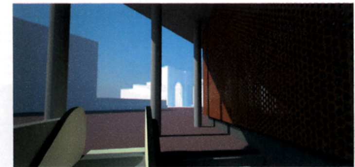
VISTA DE LA SORTIDA DEL METRO