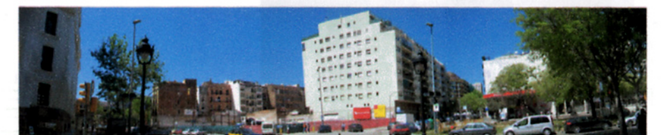
vista de la parcel·la