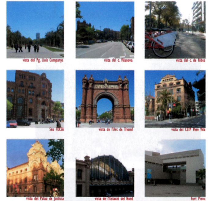
vista del Pg. Lluís Companys