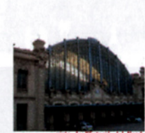
vista de l'Estació del Nord