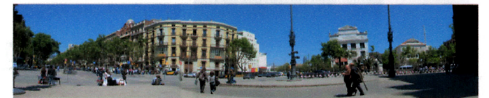
vista des de l'Arc de Triomf