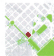
emplaçament envoltat per una gran quantitat d'espais lliures públics