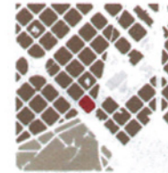
peculiaritat de l'illa en qüestió xarxera entre barris que absorbeix la diferència entre trames veïnes