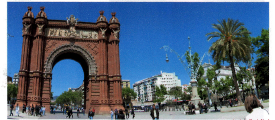
vista des de l'Arc de Triomf