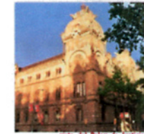
vista del Palau de Justícia