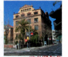
vista del LESI Pere Vila