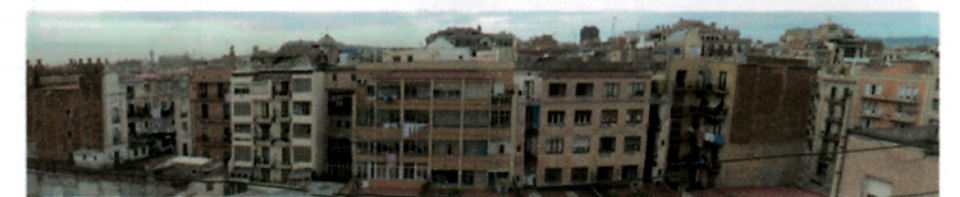
vista de l'interior d'illa