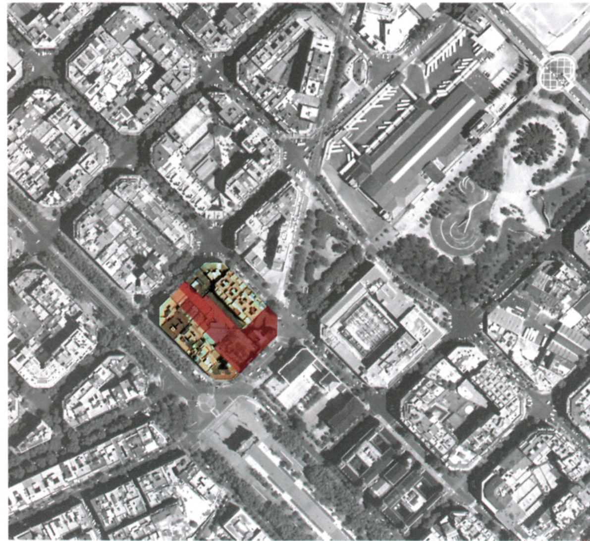
plànol entorn-emplaçament 1/2000