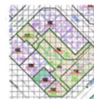
plànol urbanístic de l'emplaçament