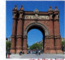
vista de l'Arc de Triomf