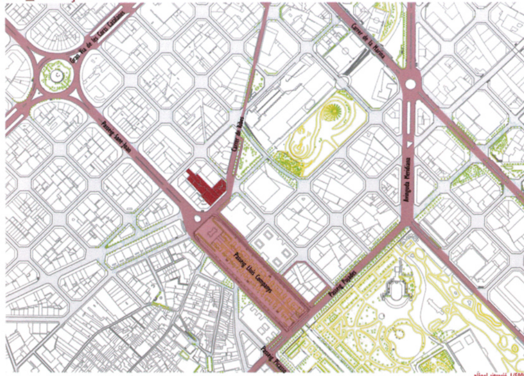
plànol situació 1/5000