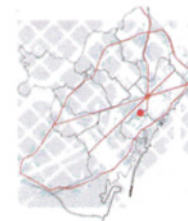
Situació de l'emplaçament del projecte respecte la ciutat

L'edifici, doncs, es situarà en un entorn privilegiat i per tant es podrà gaudir des de l'interior d'unes immillorables vistes. Cal tenir en compte que la integració al lloc s'haurà de realitzar amb la màxima cura.