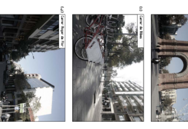
(A) Carrer de Ribes (B) Carrer de Ribes (C) Carrer de Ribes (D) Carrer de Ribes (E) Carrer de Ribes (F) Carrer de Ribes (G) Carrer de Ribes (H) Carrer de Ribes (I) Carrer de Ribes