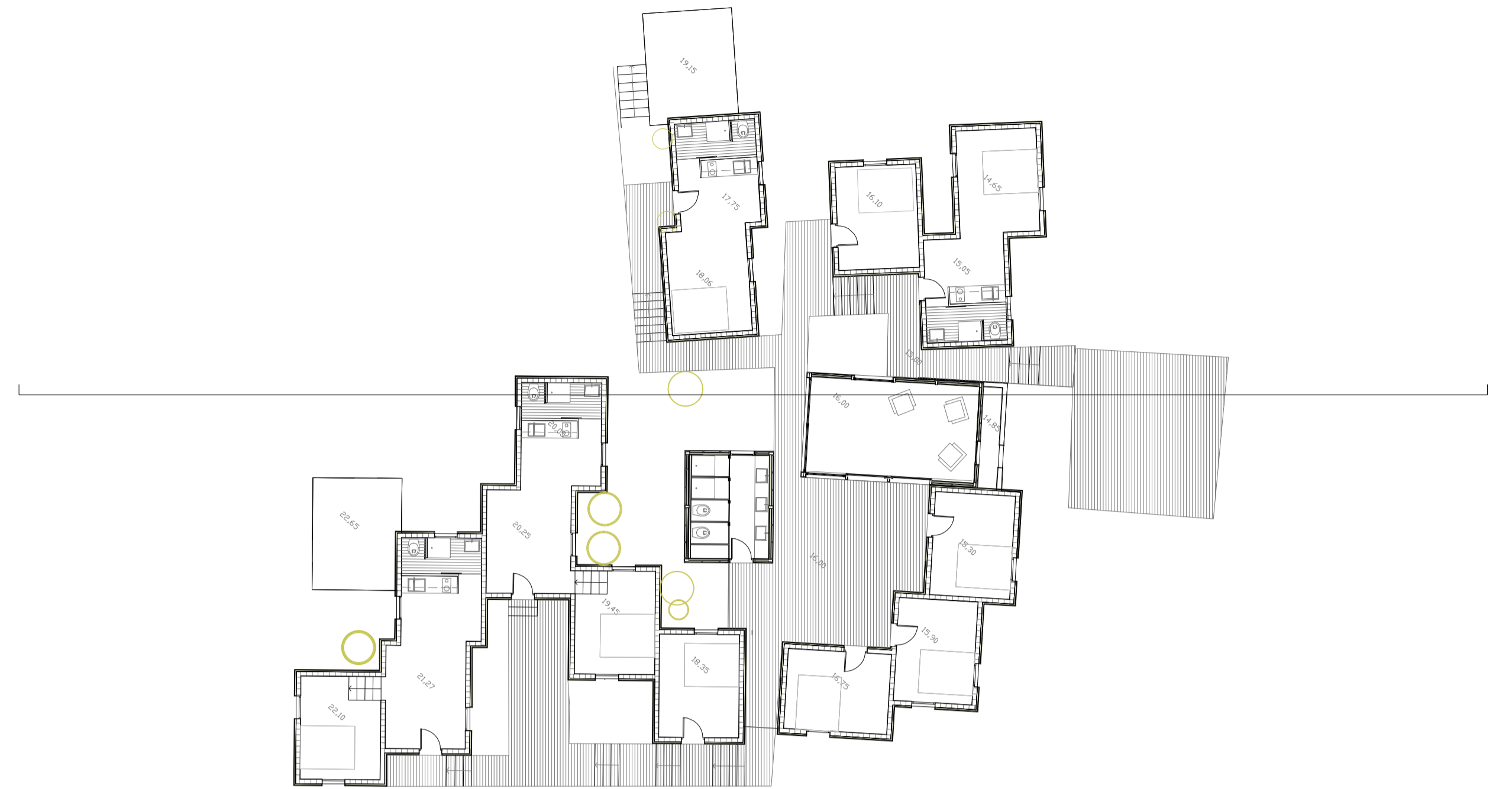
AGRUPACIÓ D'UNITATS ENTORN UN PATI E 1/100

LA INTERVENCIÓ EN LES UNITATS EXISTENTS PRETÉN MANTENIR AL MÀXIM EL SEU ASPECTE ACTUAL. CONSISTEIX EN RECOBRIR EL CONJUNT D'UNITATS AMB PLAQUES DE POLIESTIRI, MALLASSO I ARREBOSAT. ES MANTÉ L'ESTRUCTURA I FORJAT ACTUAL, REFORÇANT LES OBERTURES QUE ES FACIEN PER TAL D'ADREJAR UNITATS. EN COBERTA, S'ARRECARÀ LA TEL·LA I ES POSARÀ UNA CAPA D'ALLAMENT I IMPERMEABILITZACIÓ, PER DESPRÉS TORNAR A COLOCAR-HI LA TEL·LA. L'ARREBOSAT HA D'ARRIBAR FINS A DALT DE MANERA QUE EL CANTELL DE LA TEL·LA SIGUI APENES PERCEPTIBLE. ELS NOUS ELEMENTS ES COL·LOQUEN SOBRE LA ROCA O LES PREEXISTÈNCIES MITJANÇANT PILARS DE FUSTA, AMB UNA BASE DE TRANSICIÓ. ESTARAN CONSTRUÏTS AMB ESTRUCTURES LLEUGERES DE FUSTA MUNTADA EN SEC, RECOBERTES AMB PANELLS SANDWICH PREFABRICATS, ACABAT DE LAMES DE FUSTA I COBERTA DE XAPA METÀL·LICA. EL VOLUM DE LA SALA COMUNA PRESENTA OBERTURES QUE OCUPEN QUASI TOTA LA SUPERFÍCIE DE FAÇANA. COMBINACIÓ DE PANELLS FIXES DE POLICARBONAT AMB ESTRUCTURA D'ALUMINI I PORTES I FINESTRES DE VIDRE AMB FUSTERIA D'ALUMINI.