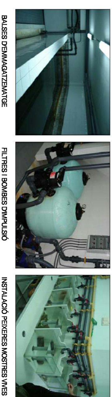
BUNISS DE MANUTENCIÓ