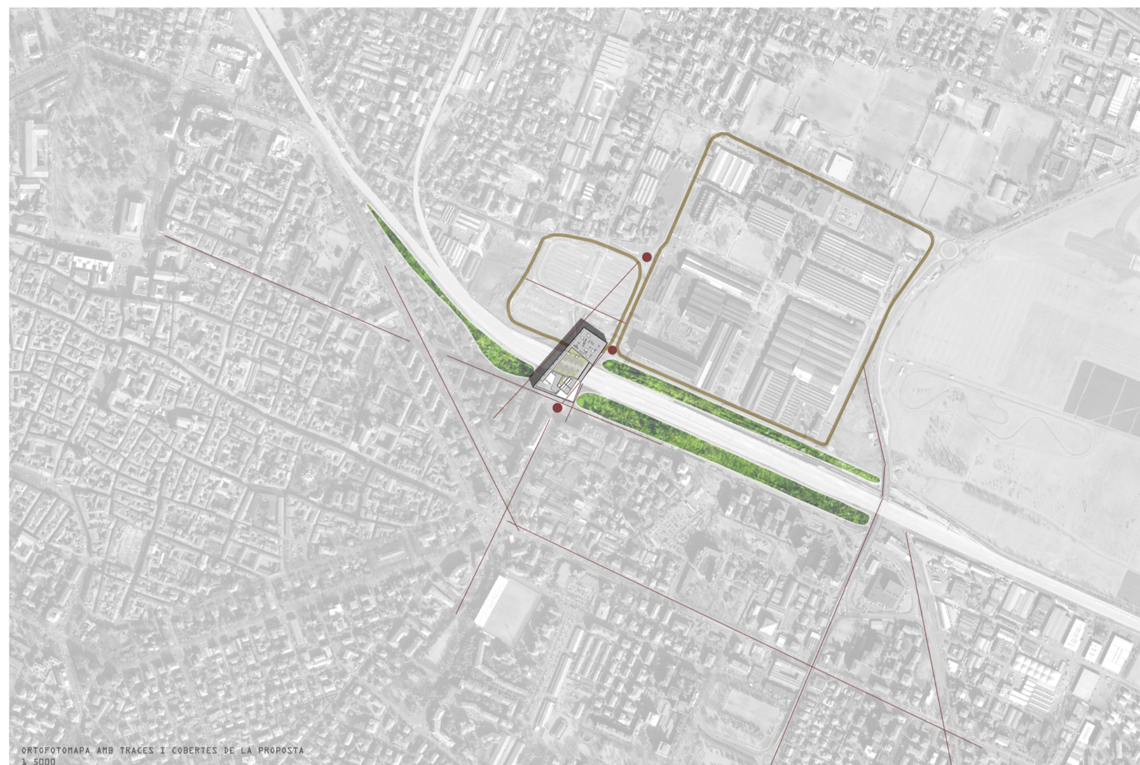
ORTOFOTOMAPA AMB TRACES I COBERTES DE LA PROPOSTA 1_5000