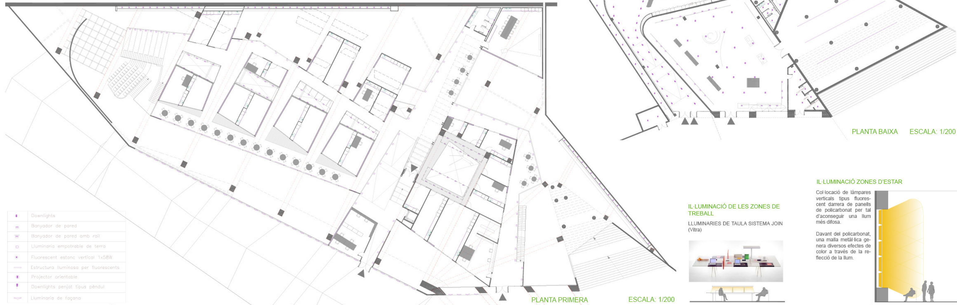
PLANTA BAIXA ESCALA: 1/200