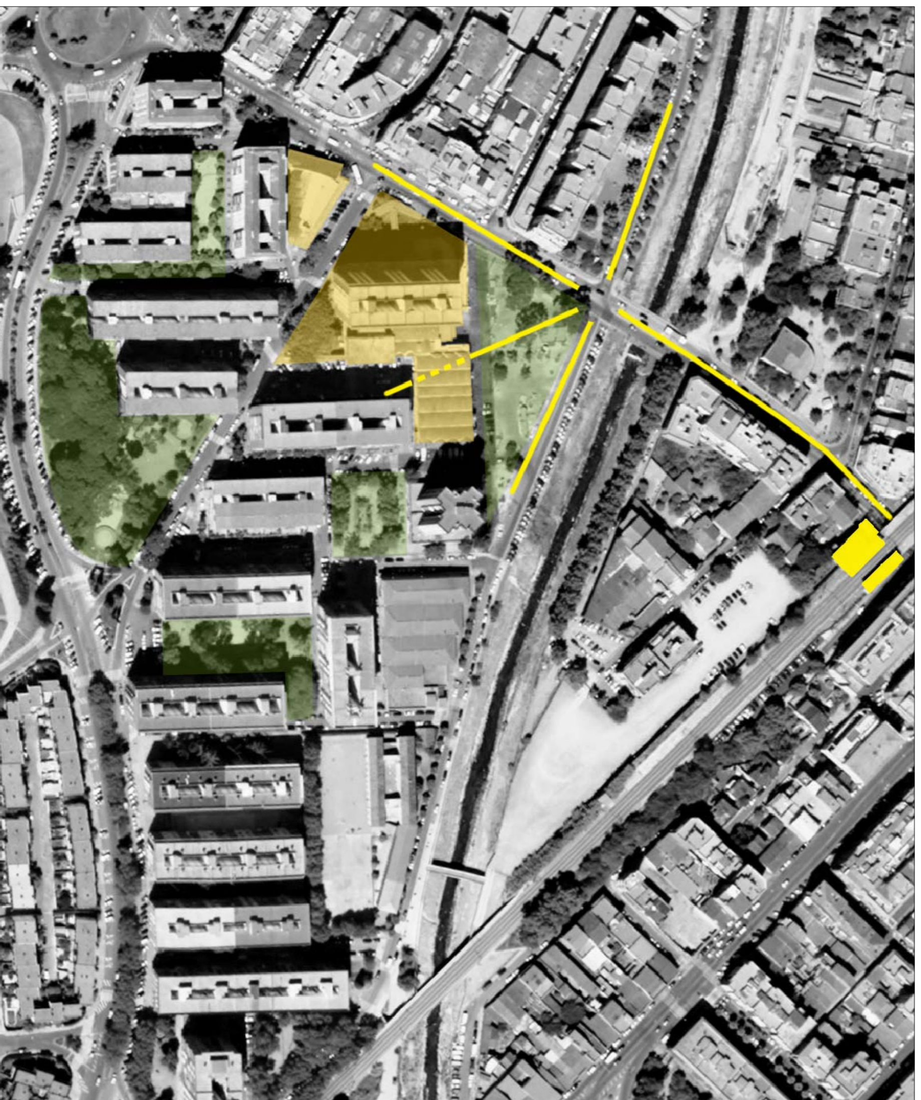
Entorn urbà de la proposta amb l'estadío de tren