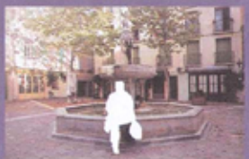
PLACE DES NEUFS JETS Va ser construïda durant el regnat dels Reis de Mallorca i simbolitza la importància de l'aigua al poble.