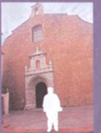
ESGLÉSIA SAINT-PIERRE Es troba al centre del poble. Té una façana molt senzilla però per la qualitat dels seus retaules és una de les grans esglésies barroques del Rosselló.