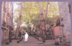
BOULEVARD MARÉCHAL JOFFRÉ És el passeig comercial del poble i s'hi troben la majoria de botigues. Conté plataners centenaris.