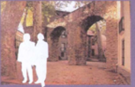
LES ARCADES Es troben aprop de la plaça de Picasso i són un lloc important de reunió de la gent del poble.