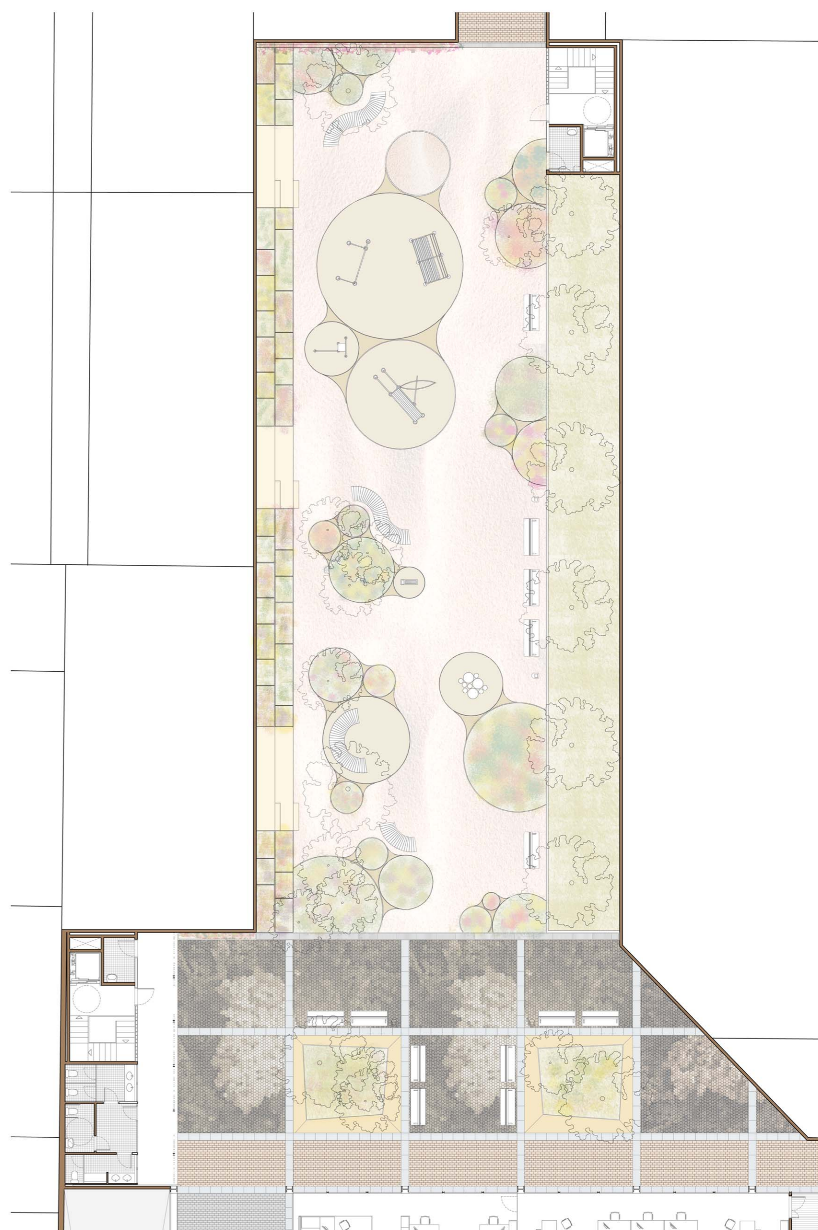
Planta Pati Interior