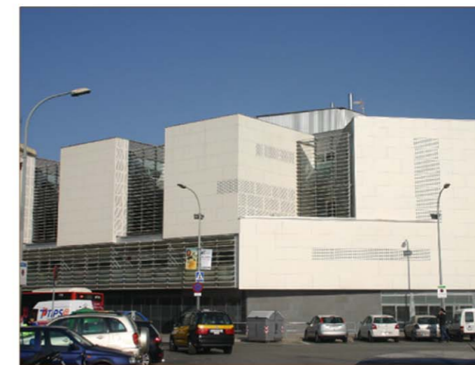
5. Fort Pienc ●