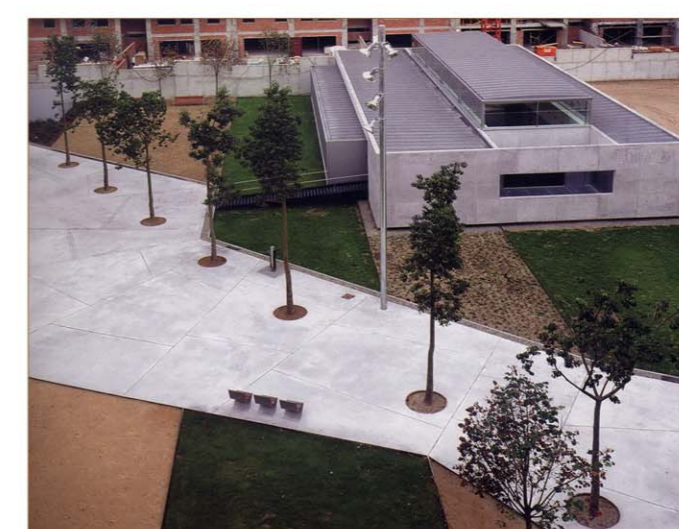
6. C.A.P. i Pati Interior ●

Cal destacar la proximitat de diferents equipaments de caràcter local i edificis de cert interès arquitectònic com el Palau de Justícia, l'escola CEIP Pere Vila (obra noucentista), l'edifici de la Central Elèctrica Catalana (ara seu de FECSA), l'estació del Nord, el complex de Fort Pienc i un C.A.P. situat en una illa recuperada de l'Eixample. Aquests equipaments i edificis, situats al llarg de eixos que marquen una successió d'elements urbans importants, tindran importància en la configuració del nou edifici per a la Seu del Col·legi de Farmacèutics.