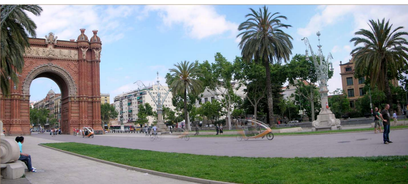
● 1. Passeig de Lluís Companys - Arc de Triomf