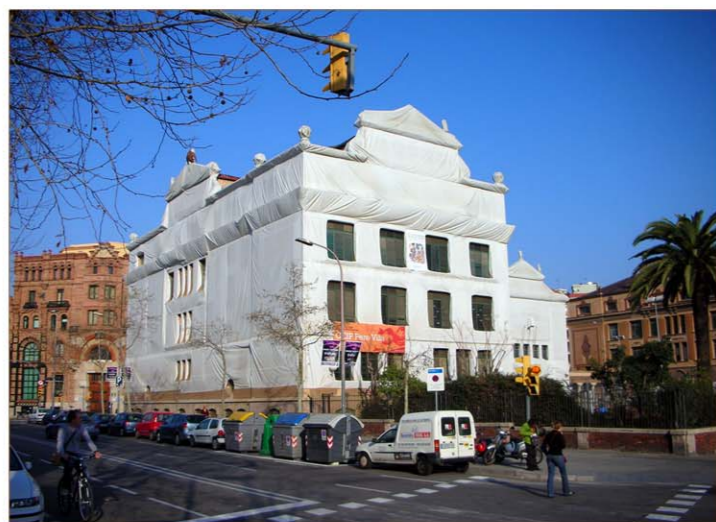
2. CEIP - Pere Vila