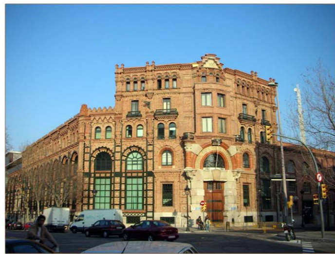
3. Central Elèctrica Catalana - Seu Corporativa