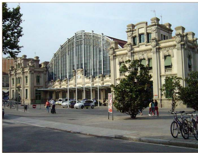
4. Estació del Nord ●