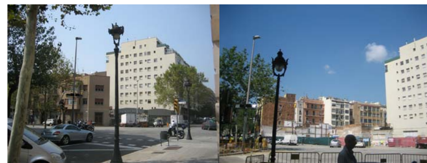
Vista del solar des de la cruïlla Av. Vilanova/Roger de Flor