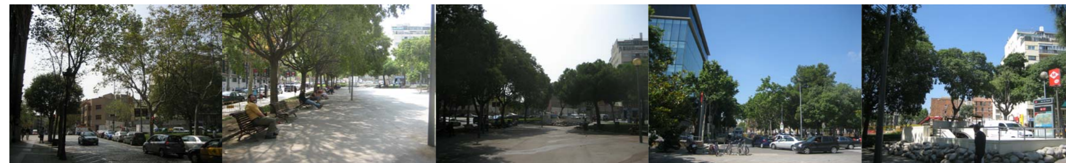
PERMEABILITAT VISUAL REDUÏDA DE LA PLAÇA ANDRÈ MALROUX PER LA GRAN MASSA VEGETAL EXISTENT