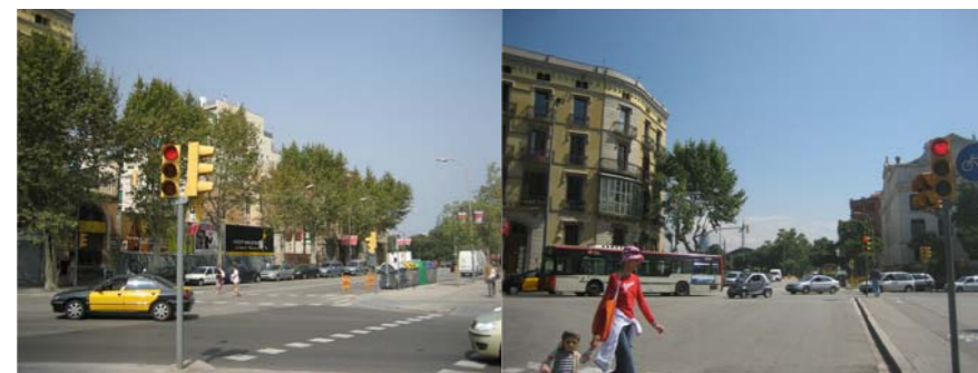
Vista del solar des del Passeig de Sant Joan