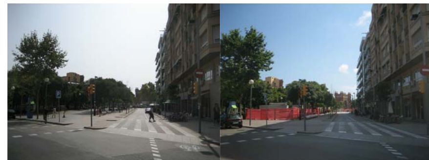
Vista cap al solar des de la Ctra. de Ribes