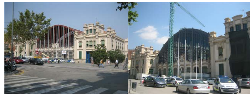
Façana en obres de l'equipament Estació del Nord