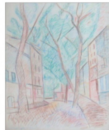
La vila de Ceret, interpretada per Gaudí, un dels artistes locals que participaren en la creació del museu amb les seves obres.

La vila de Ceret, situada a Catalunya Nord, amb capital a Perpinyà-Perpignan), compta amb uns 7000 habitants en el seu nucli i fins a 9000 residents en les seves rodalies. És un centre de serveis comercial d'un territori agrícola que havia tingut una vida artesanal (tèxtil, adob de pell, lina) vinculada a l'economia ramadera i forestal de muntanya. Com tots els pobles dels antics comtats rosselonesos, amb la separació de la Catalunya Sud a partir del segle XVIII va anar perdent els seus mercats naturals i avui és una economia subsidiària de la de la resta de França, basada en el turisme, el lleure, el comerç i altres formes de terciari. En aquest context hi juga un paper primordial el Museu d'Art Modern, instal·lat al centre de la vila, que atreu uns 100.000 visitants cada any.