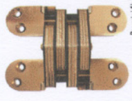
Barril·la de acer inoxidable