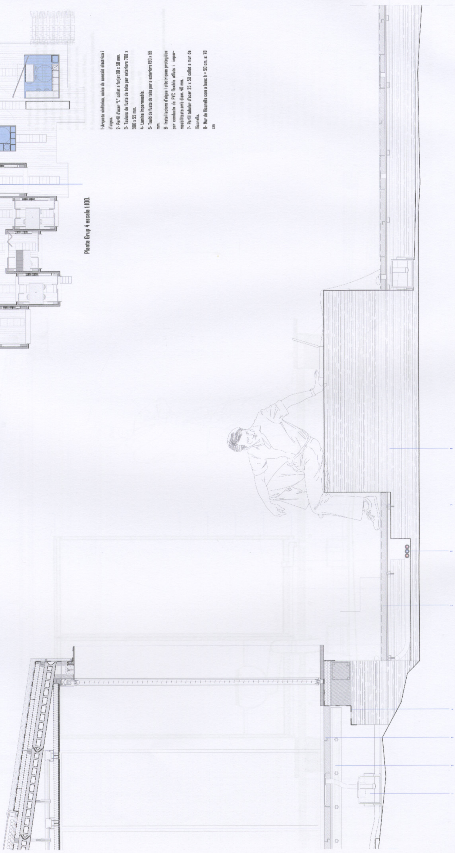
Secció detall escala 1:10.