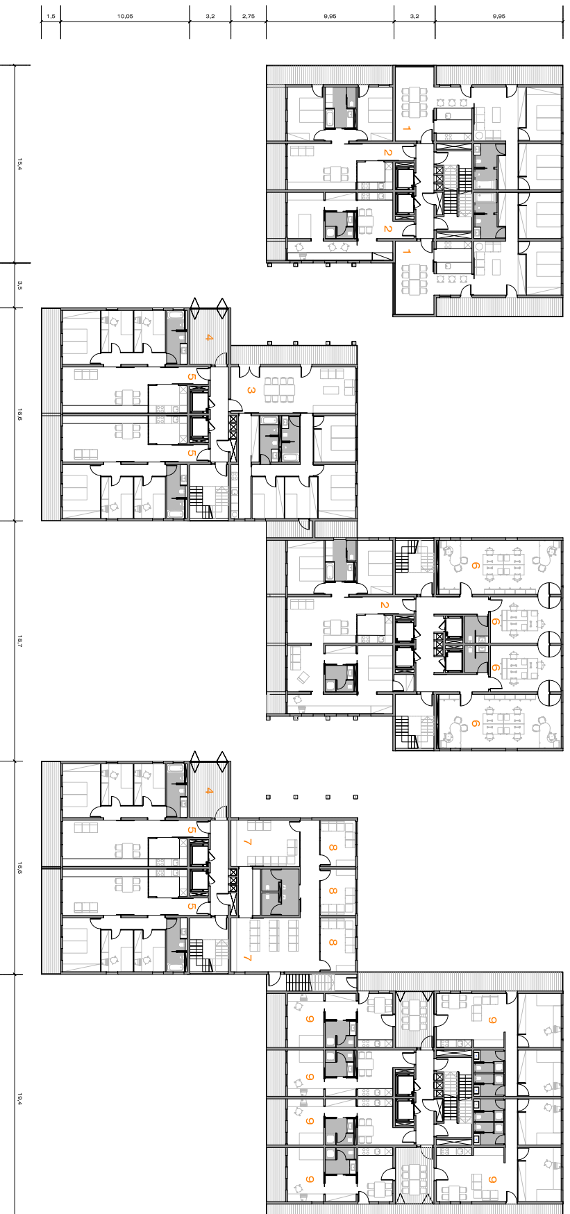
PLANTA ESTADO ACTUAL TRANSFORMACIONES