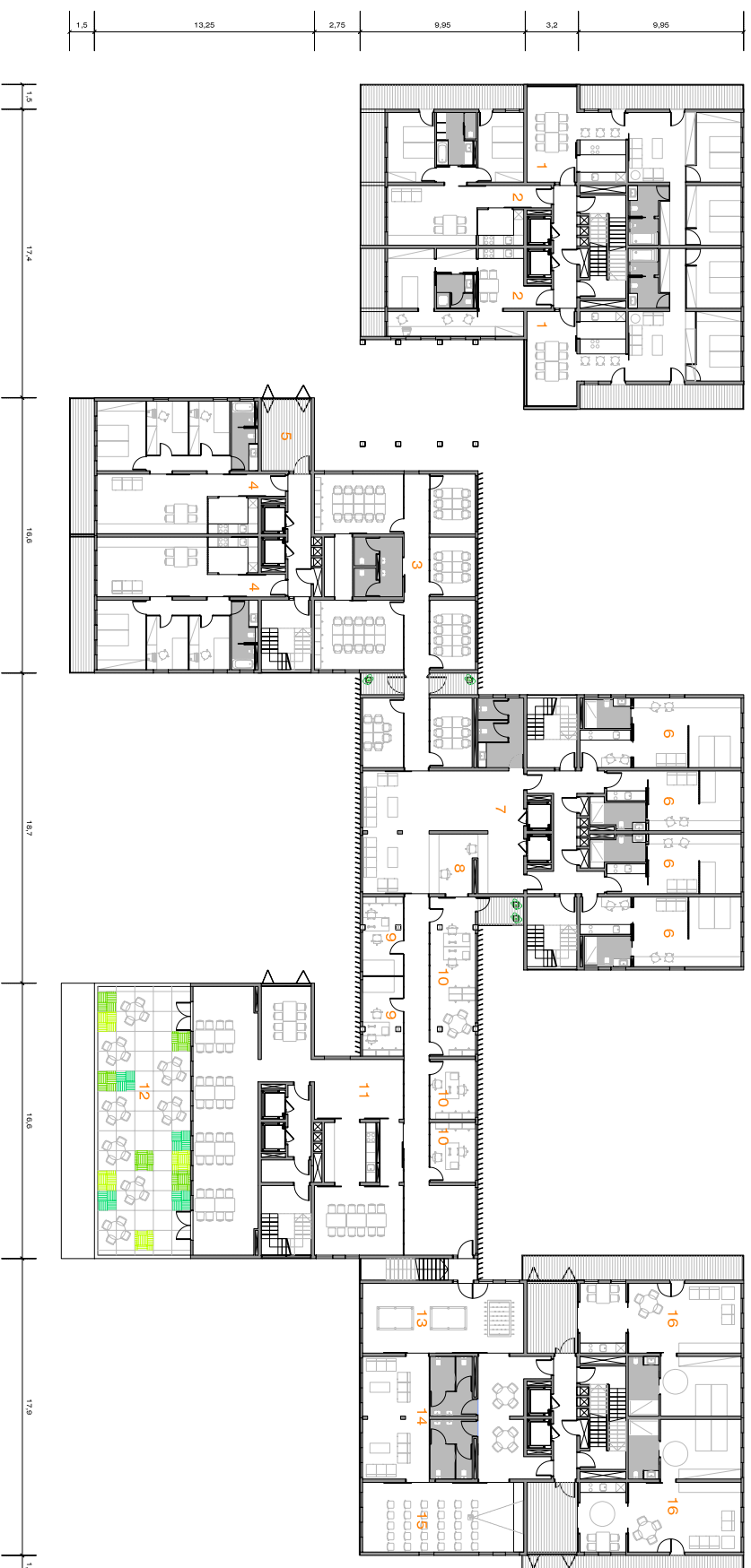
PLANTA ESTADO ACTUAL TRANSFORMACIONES