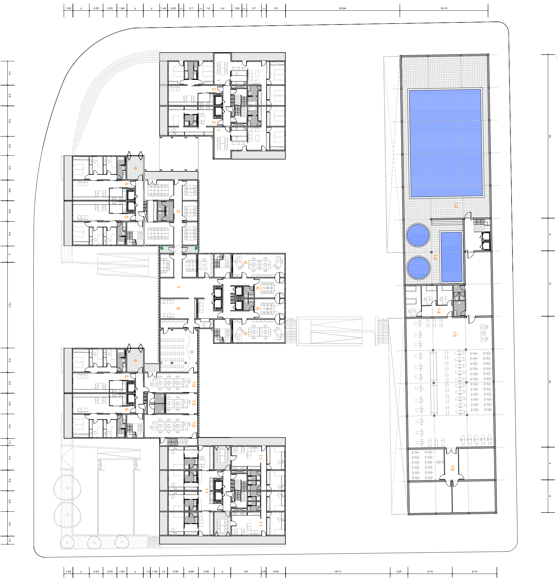
PLANTA ESTADO ACTUAL TRANSFORMACIONES