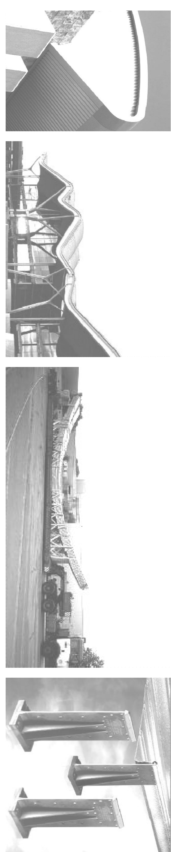
LEGENDA DE COBERTA