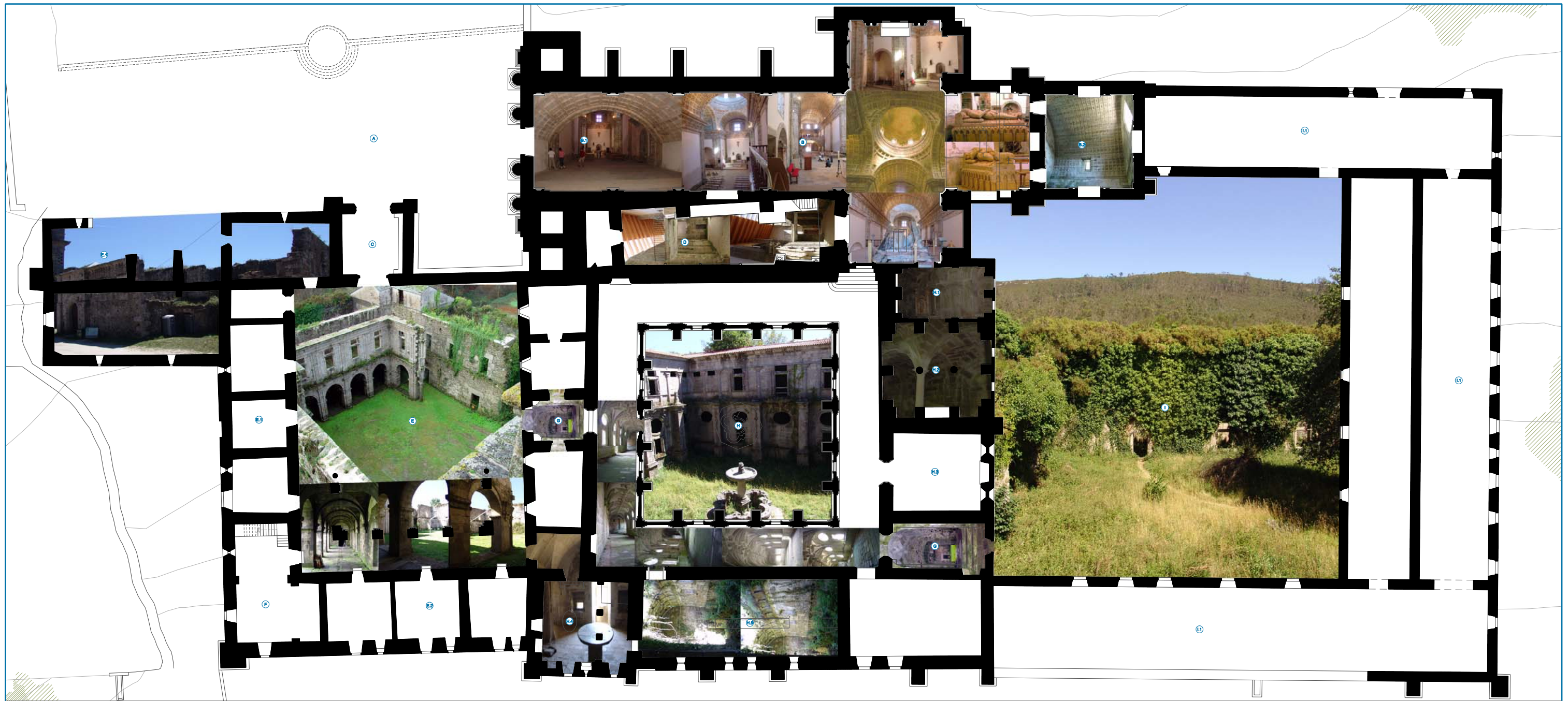
PLANTA BAIXA A Plaça escola monestir B Església C Cor D Baptista E Portes F Vestíge romànic (s.XII) G Clausure hospederia H Estables I Hospederia J Vivenda del capellà K Pas clausure L Clausure processional M Baptista N Sala capitular O Sala abacial P Cuina Q Refectori R Clausure dormitoris S Cel·les monacals