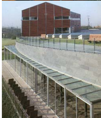
2-. ALÇAT NORD-OEST

PISCINA COBERTA EN EL CLUB DE CAMP DE ZUASTI (Pamplona), FRANCISCO JOSÉ MANGADO Aplacat de pedra de Jadish en paviment i revestiment vertical