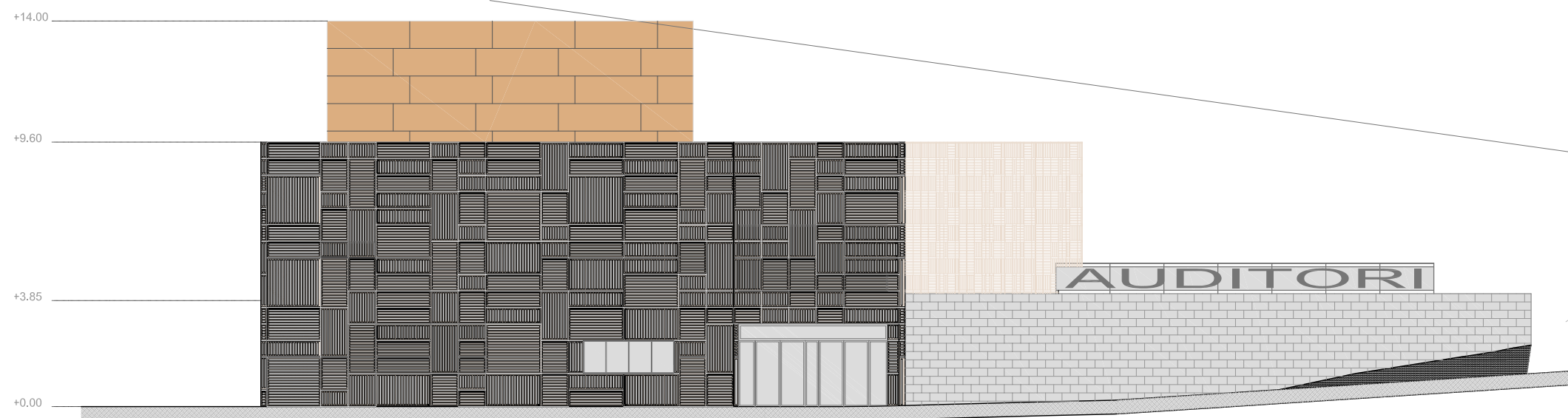
2- ALÇAT SUD-EST

PISCINA COBERTA EN EL CLUB DE CAMP DE ZUASTI (Pamplona), FRANCISCO JOSÉ MANGADO Aplacat de pedra de Jadish en paviment i revestiment vertical