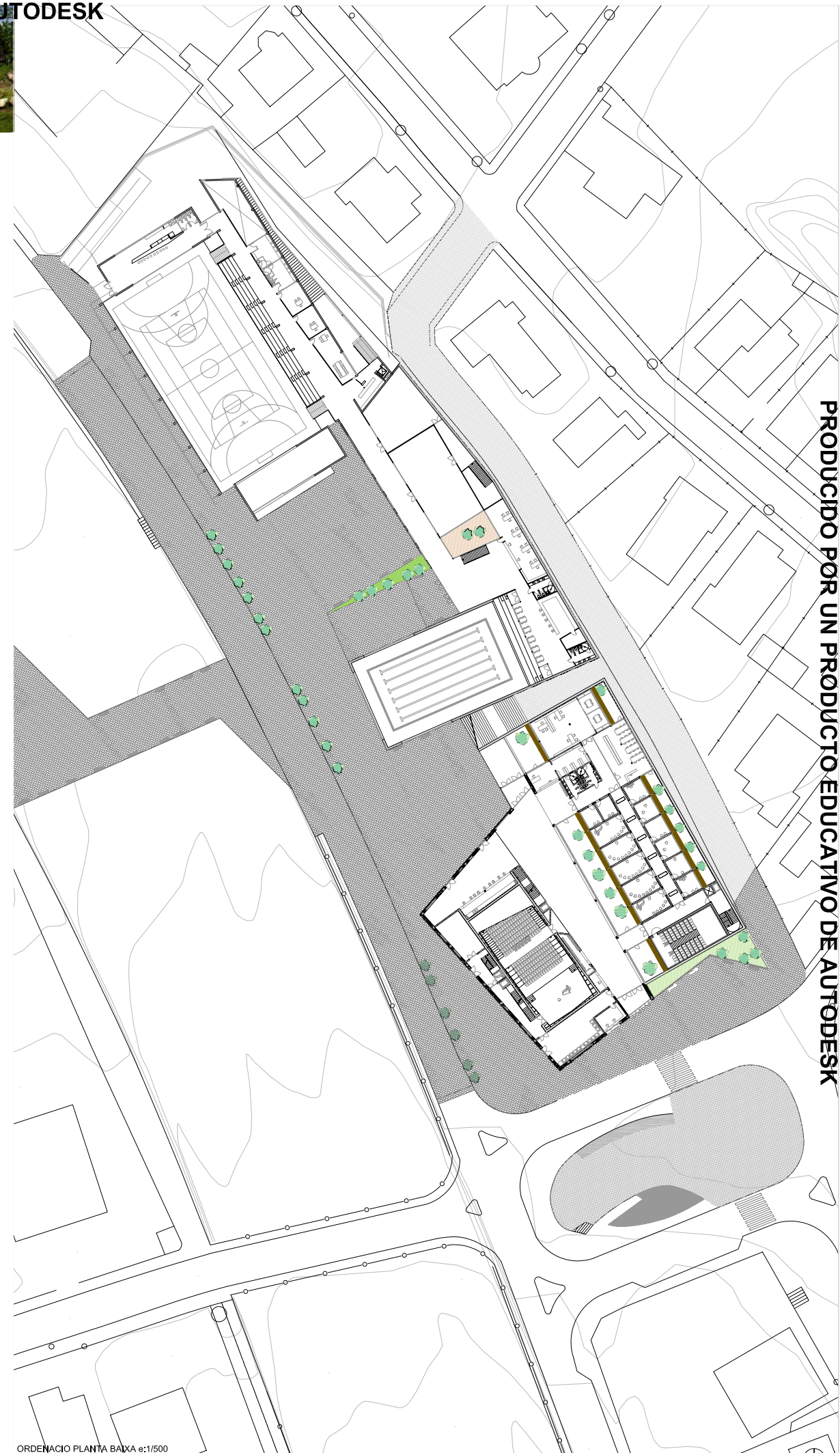
ORDENACIÓ PLANTA BAIXA e: 1/500