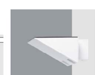
UPLIGHT TRION bañador de techo lámpara de halógenos metálicos, crea una iluminación indirecta económica