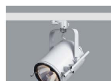
PROYECTOR TM Proyector de gran vida sobre raíles electrificados que ofrece gran flexibilidad, luz halógena de bajo voltaje