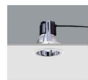
LIGHTCAST DOWNLIGHT bañador de pared: Lámpara halógena de bajo voltaje con luz brillante constante

Tanto en el anexo del ayuntamiento como en el sótano propongo una estructura luminosa de fluorescentes, ya que en dichos recintos no se necesita una iluminación focal como en el museo.