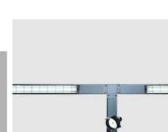
ESTRUCTURA LUMINOSA T16 lámpara fluorescente para una iluminación general