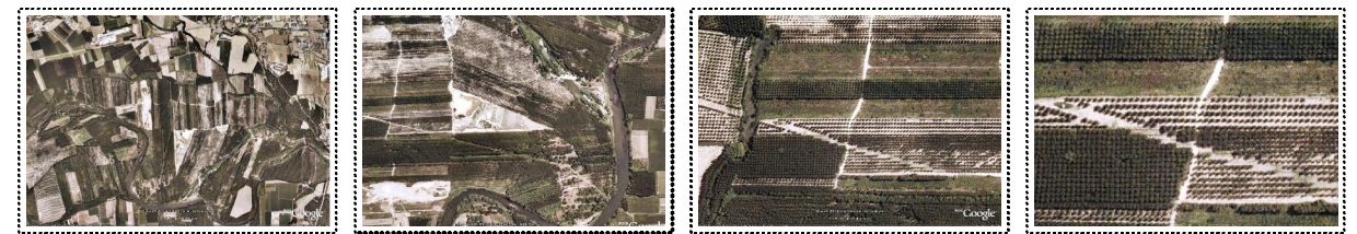
Vistas aéreas de la casa de viveros Paraiso Berdú, Girona.

A partir de este momento el árbol adquiere el diámetro de mercado y se comercializa de forma ocasional. Bajo condiciones la venta de los árboles en un plazo máximo de tres años, mientras el crecimiento de la plant año supera los 40-50 cm de circunferencia.