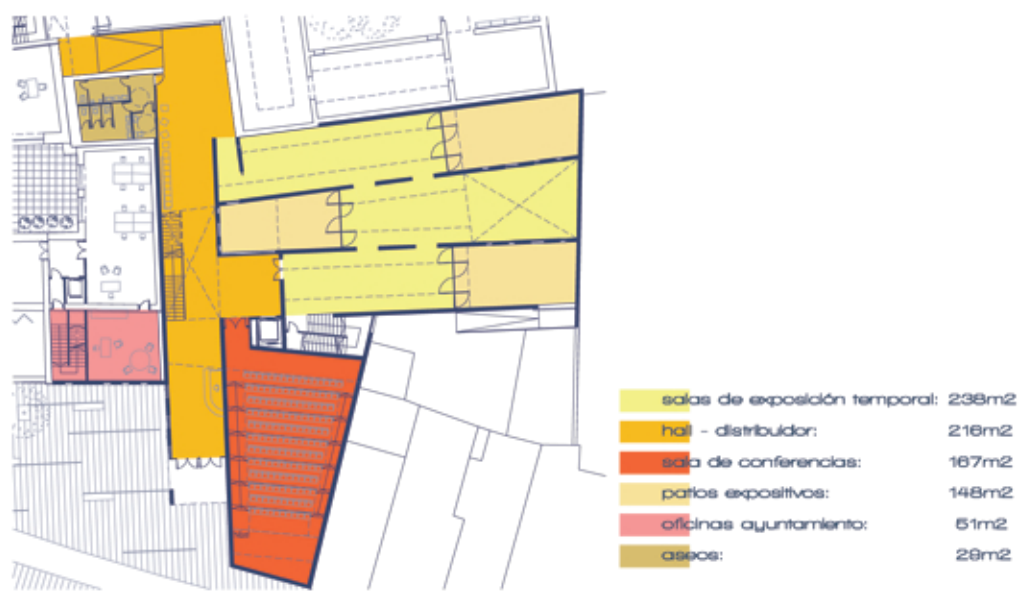
ESQUEMA USOS Y SUPERFICIES E.1/300