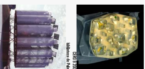
CE30 a 2010 Biblioteca de Palma