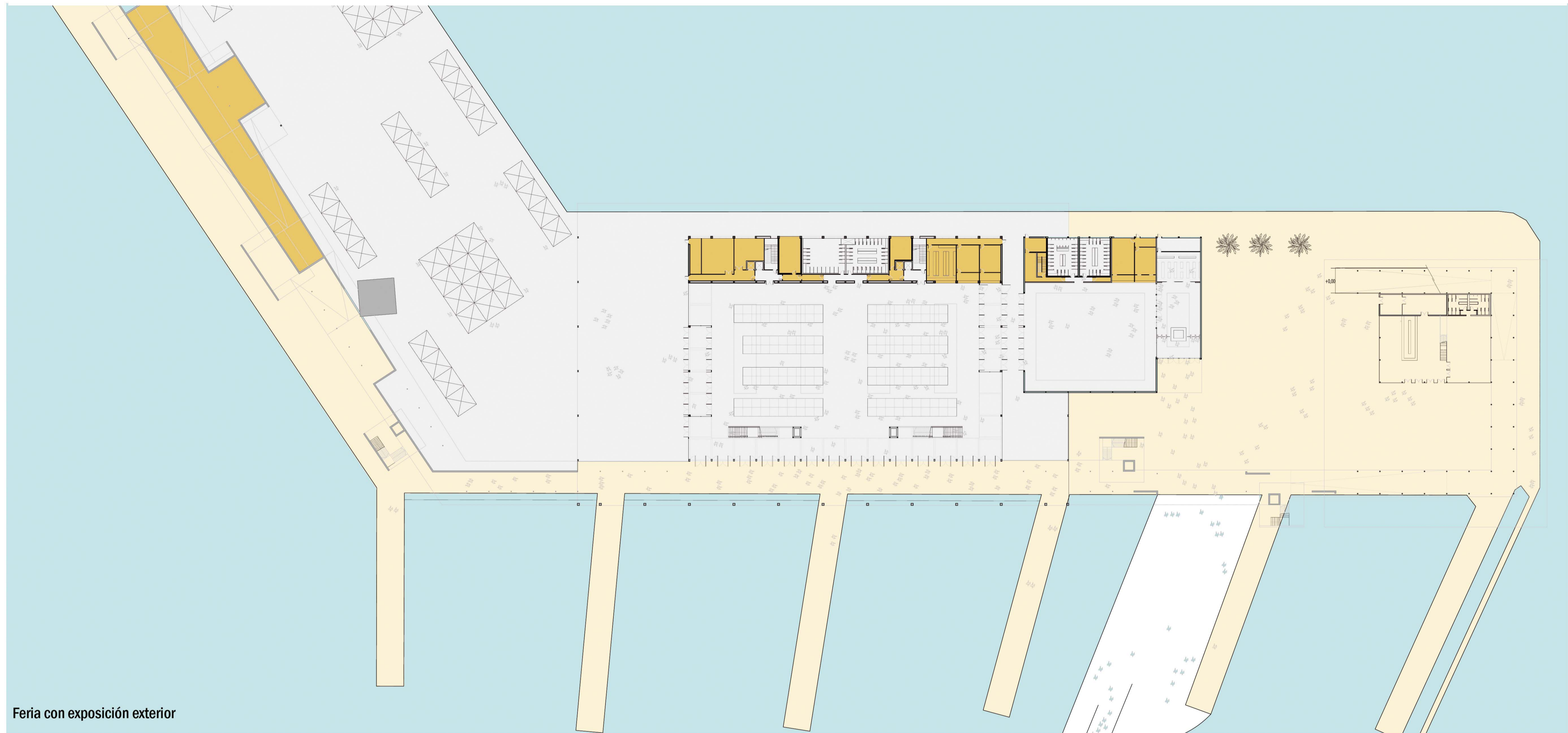
Feria con exposición exterior

Por otra parte, la misma sala cuenta con todo un frente practicable en planta baja que permite que espacio interior y espacio exterior se fundan en uno si las circunstancias así lo demandan.