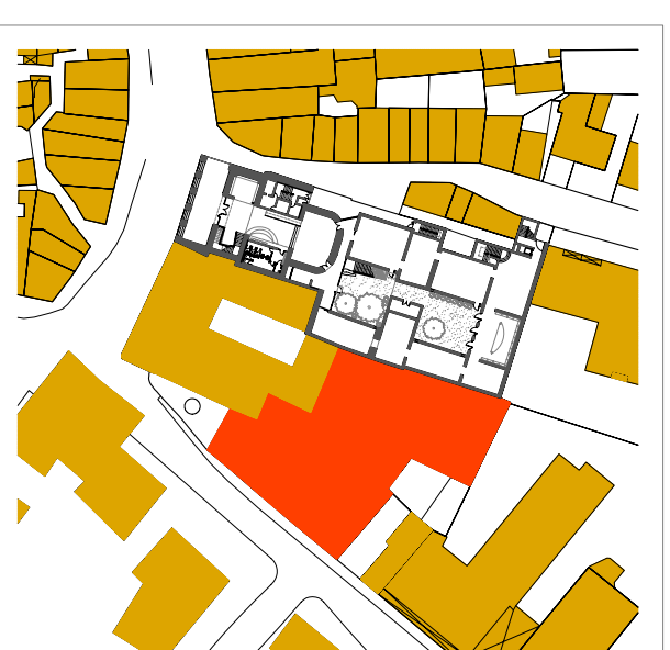
EMPLAÇAMENT AMB TERRENYS DISPONIBLES PER A L'AMPLIACIÓ