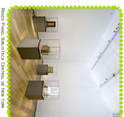
RENZO PIANO, BIBLIOTECA CENTRAL DE NEW YORK