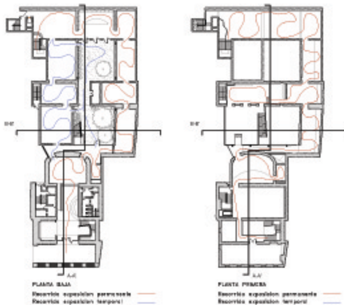
RECORRIDO MUSEO ACTUAL E 1/200