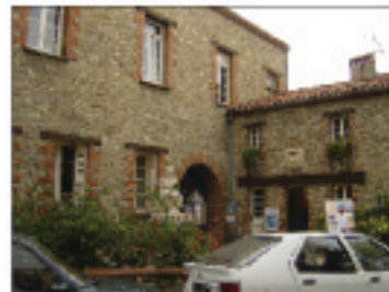
3.VISTA LATERAL AYUNTAMIENTO