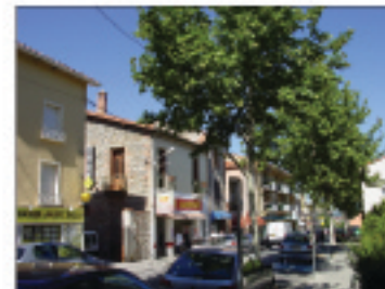
4.VISTA AV.GEORGES CLEMENCEAU