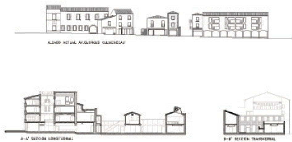
SECCIONES MUSEO ACTUAL E 1/200