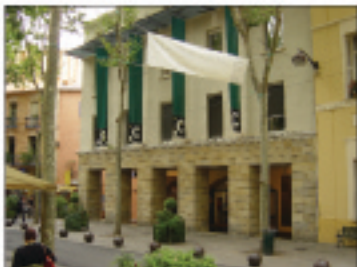
1.VISTA FACHADA MUSEO