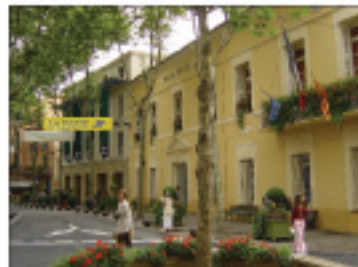
2.VISTA FACHADA AYUNTAMIENTO AV.MARECHAL JOFFRE