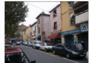
5.VISTA AV.GEORGES CLEMENCEAU