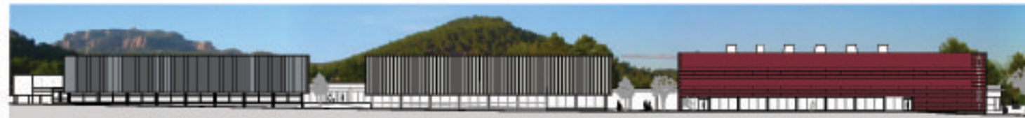
FAÇANA CARRER ENRIC GINESCA CORTES ALÇAT RIERA DE LES ARENES E: 1/500