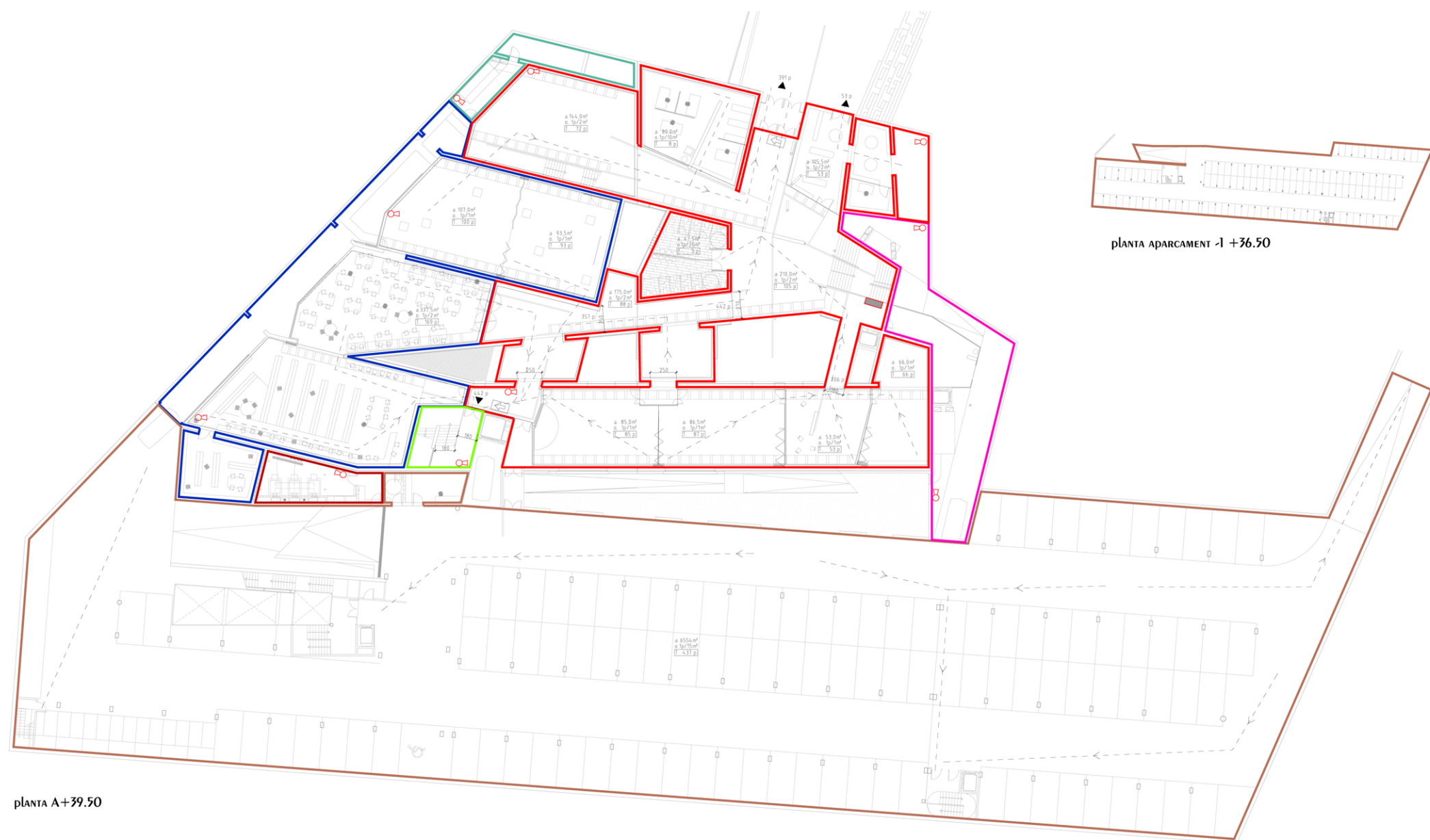
planta A +39.50