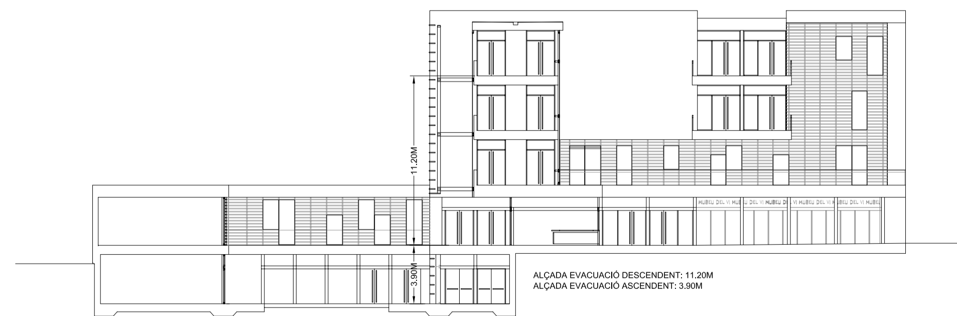
ALÇADES DE EVACUACIÓ