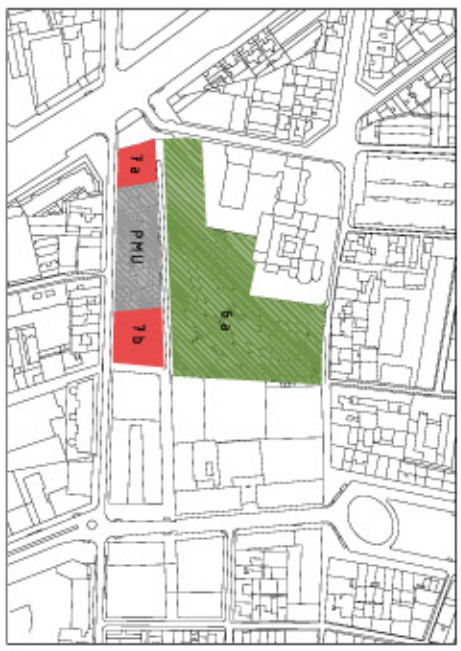
PHU. MODIFICACIÓ PUNTUAL

SUPRESSIÓ DE L'EXTENSIÓ DELS MARRS DE SANT PAU