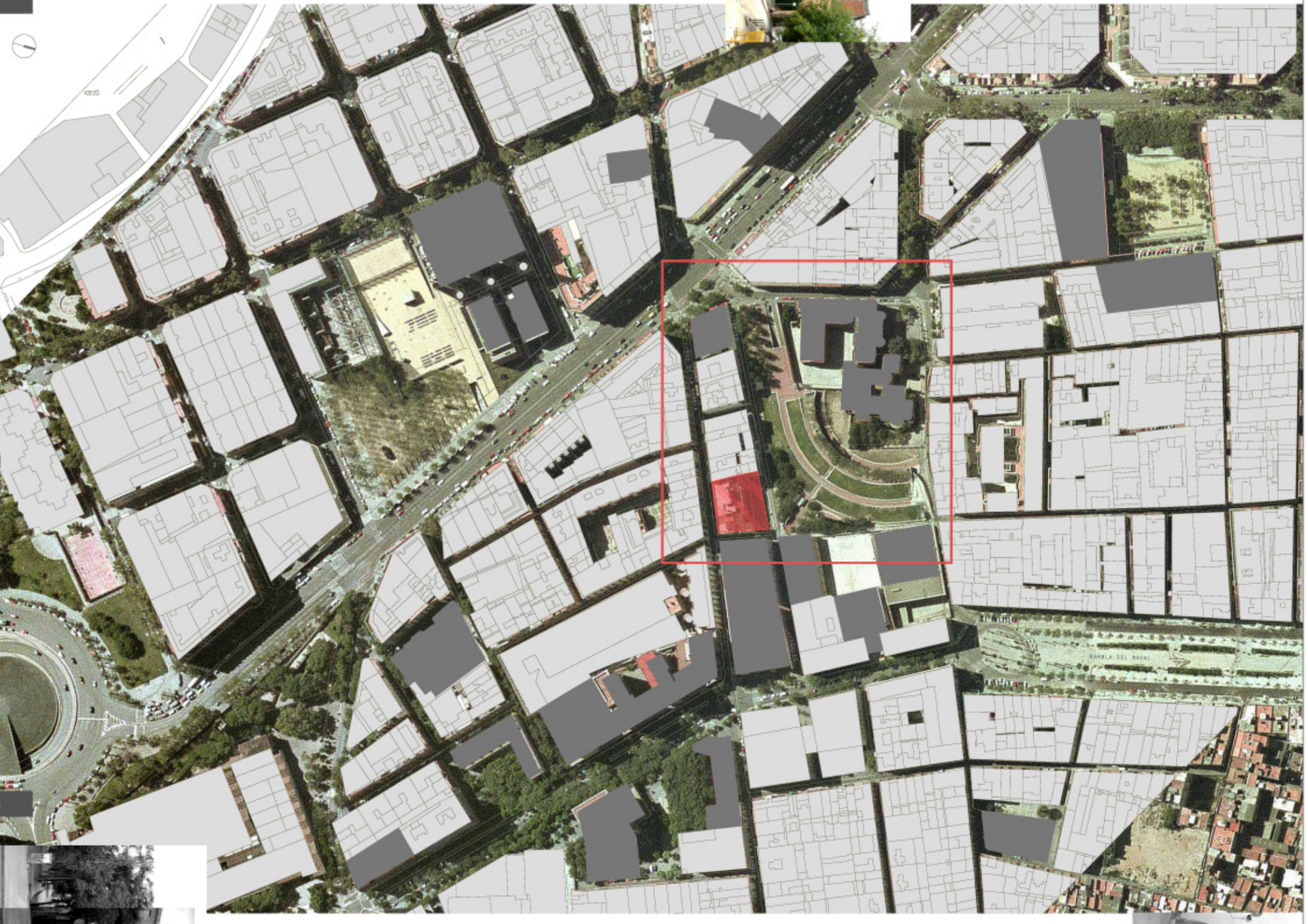
ELEMENTS INTERESSANT A POTENCIAR VISUALMENT