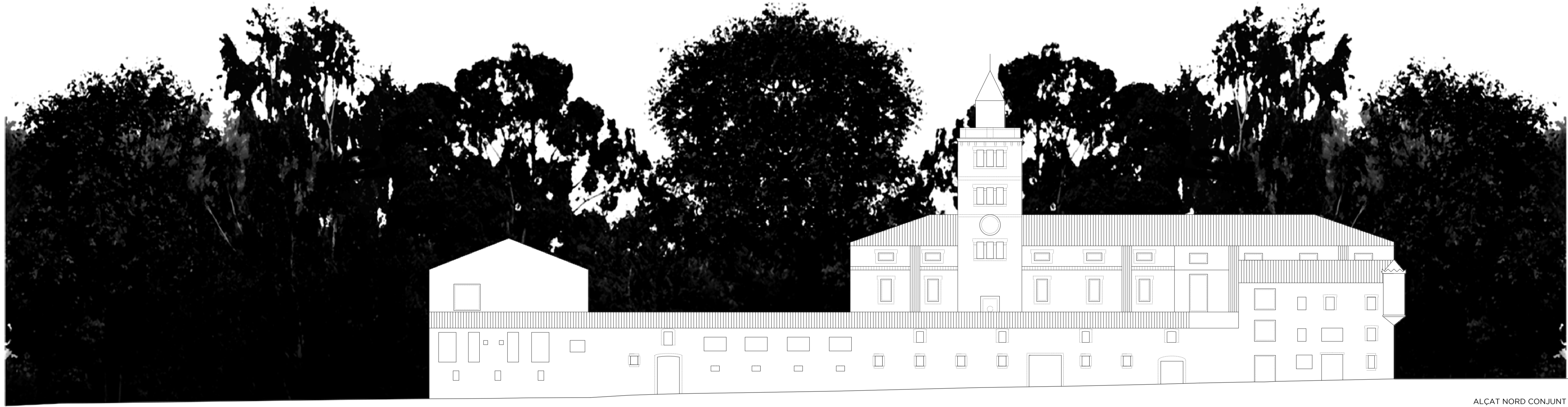
ALÇAT NORD CONJUNT ESCALA 1:200