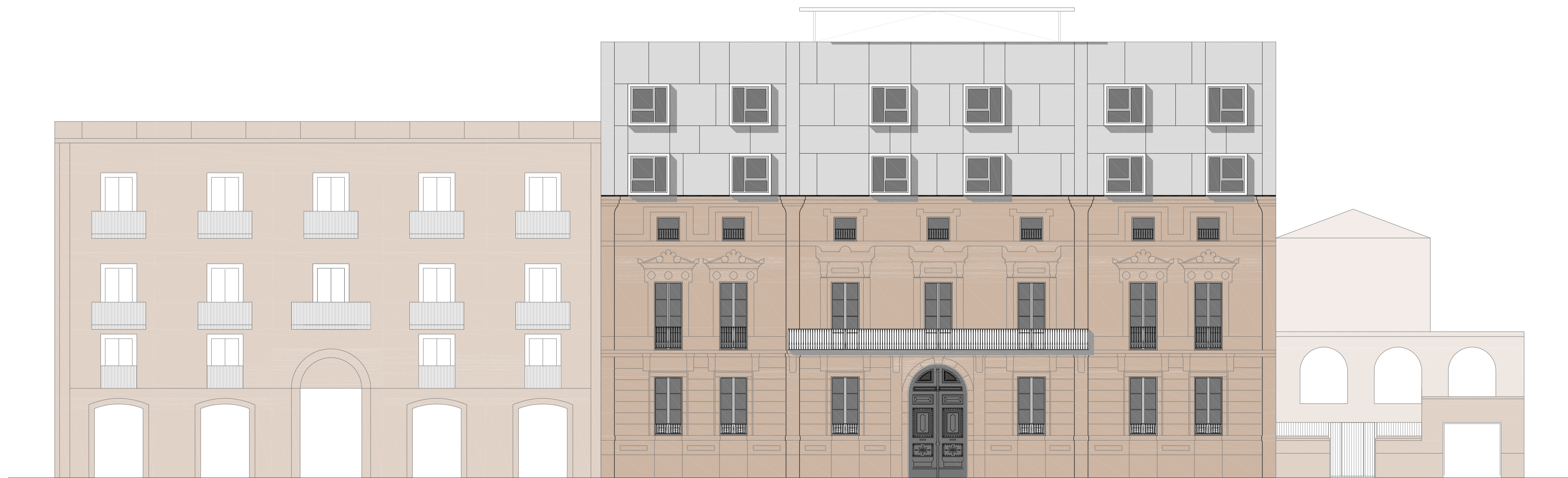
ALÇAT PRINCIPAL_CARRER NOU