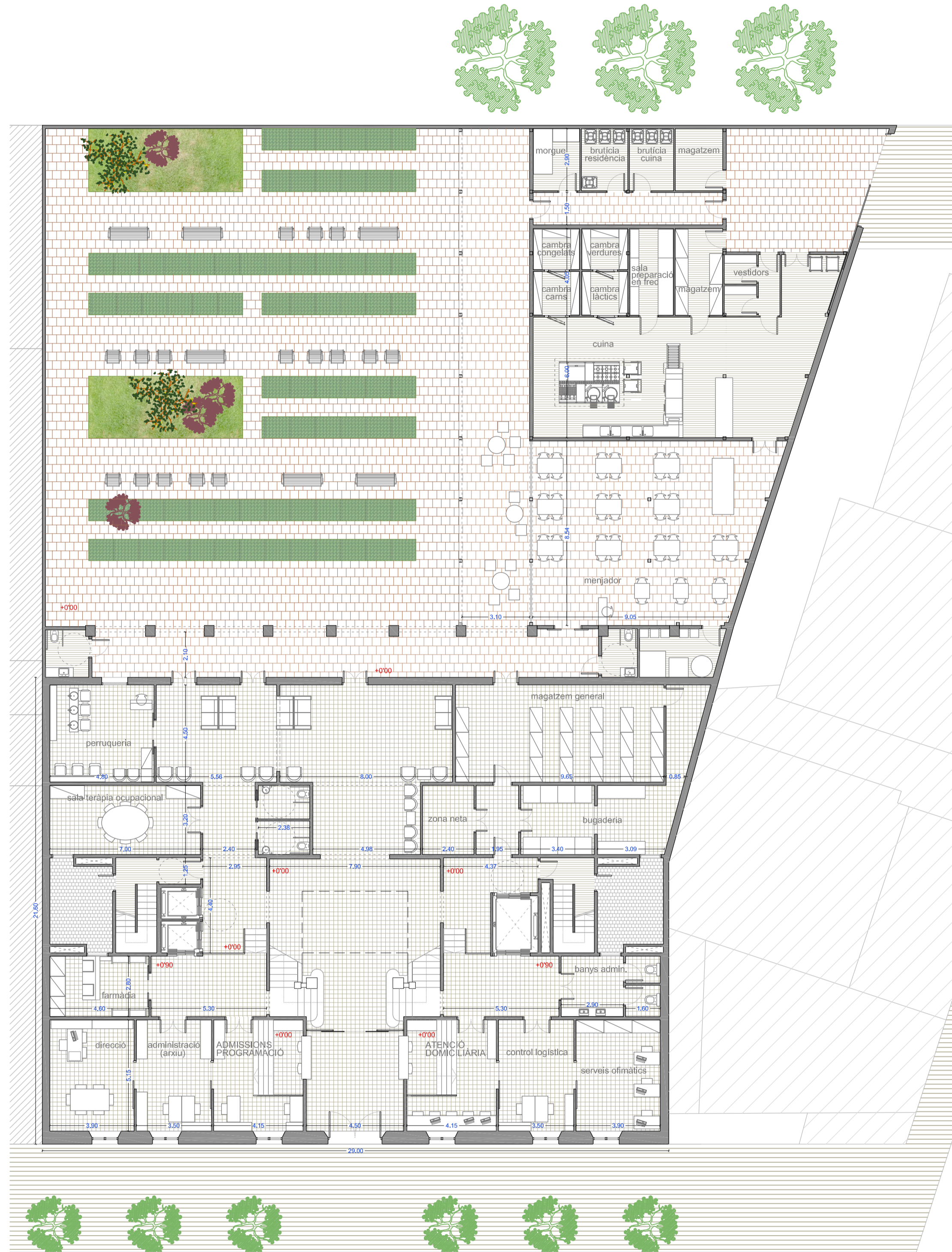
PLANTA BAIXA _ cota ±0'00