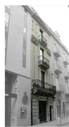
1 - CASA ALEGRET, 1856 arquitecte: Josep Roca i Bros Promoguda per uns antics fabricants de sabó.