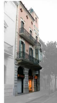
4 - CASA PAGÈS, 1906 arquitecte: Josep Martí Roca Promoguda per un important industrial del sabonet i l'electricitat.