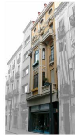
2 - CASA JUCLÀ, 1912 arquitecte: Pelayo Martínez Paricio