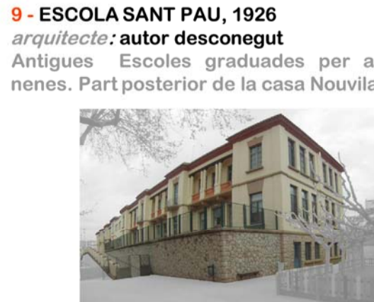
9 - ESCOLA SANT PAU, 1926 arquitecte: autor desconegut Antigues Escoles graduades per a nens i nenes. Part posterior de la casa Nouvilas.