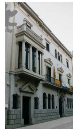
5 - CASA PAGÈS BOFILL, 1928 arquitecte: Francesc Tarragó Promoguda per un important industrial del sabonet i l'electricitat.