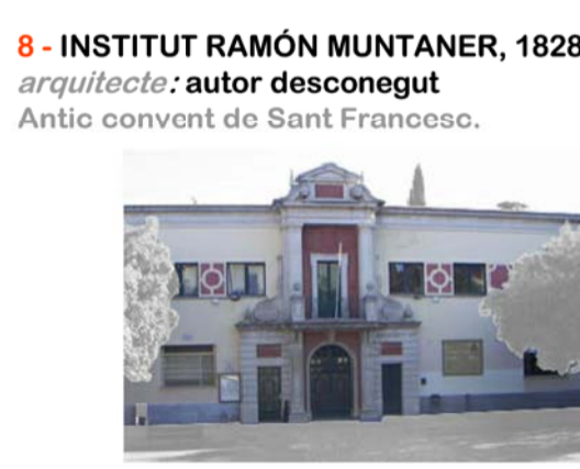
8 - INSTITUT RAMÓN MUNTANER, 1928 arquitecte: autor desconegut Antic convent de Sant Francesc.