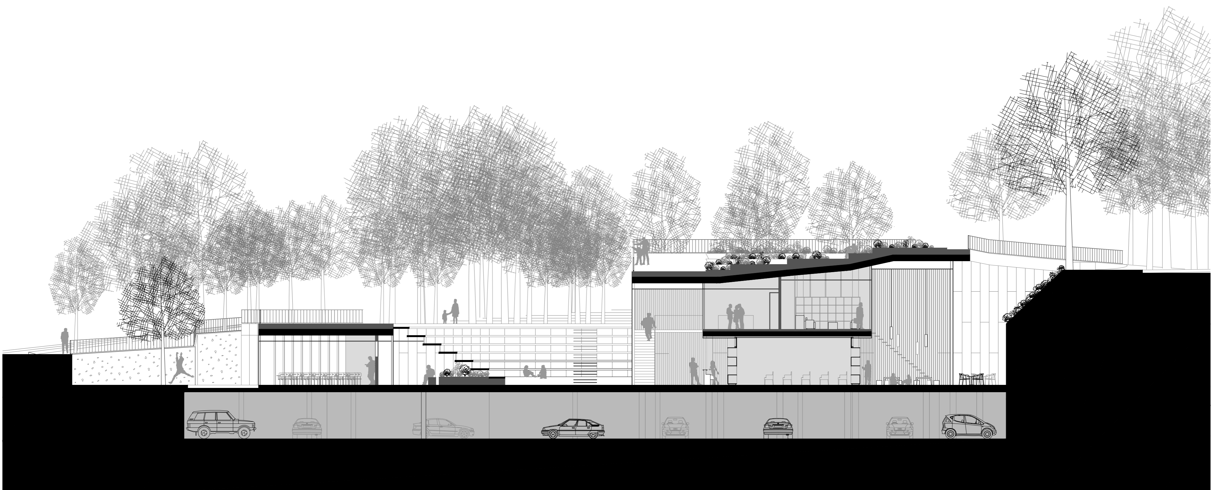
SECCIÓ TRANSVERSAL 03