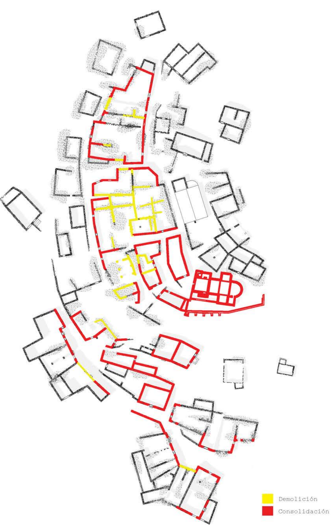
Esquema de demolición y consolidación de muros