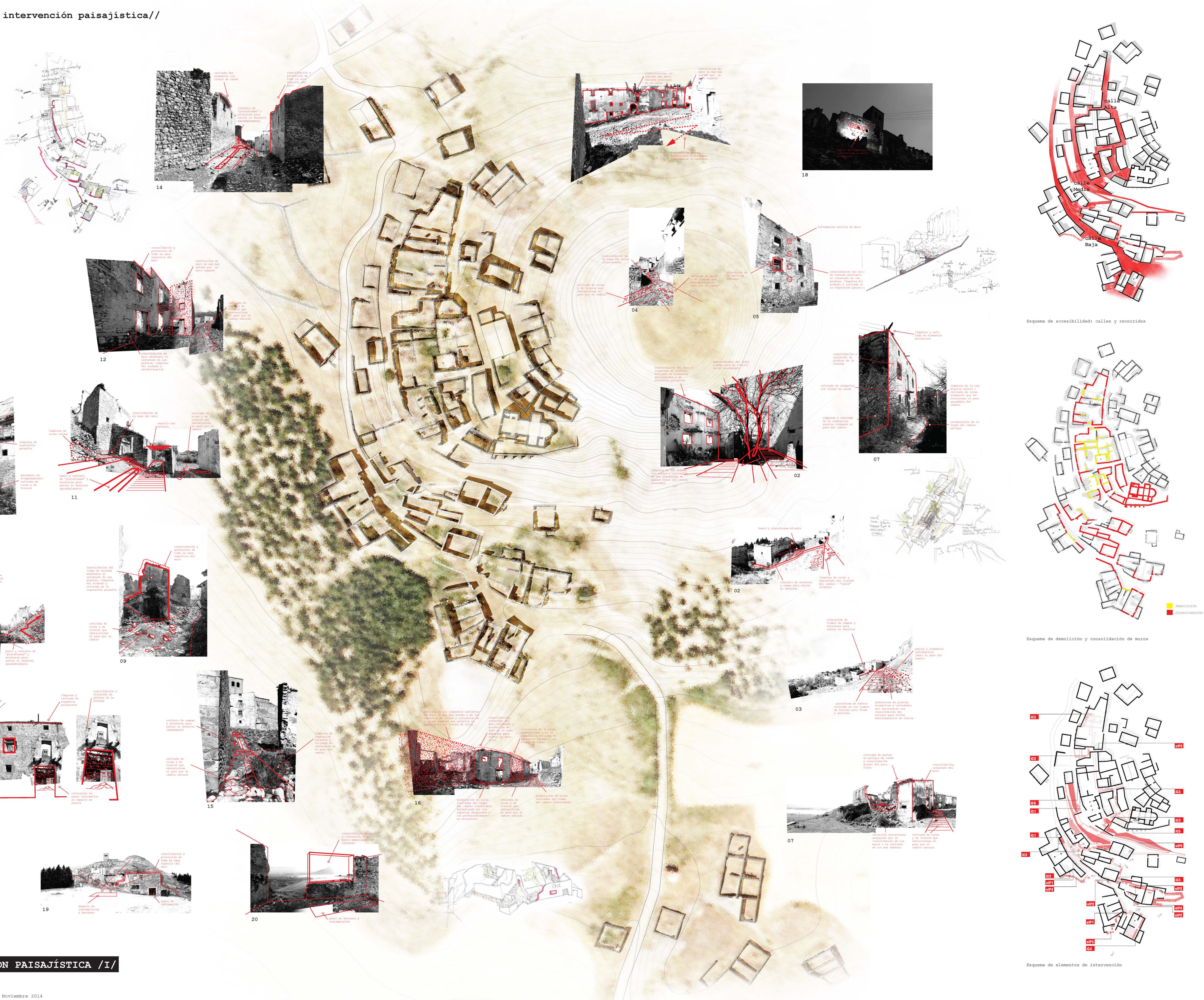
Esquema de accesibilidad: calles y recorridos

Tanto unas actuaciones como otras, se plantean desde la sencillez de los materiales y las soluciones constructivas, para que puedan ser realizados de forma participativa y paulatina de forma que se pueda ir avanzando hacia un futuro proyecto construido.