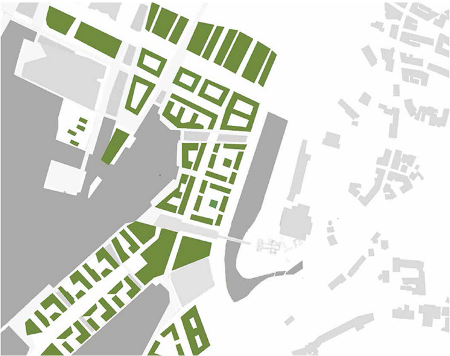
B. NOVA BJØRVIKA. A partir de la creació d'una península artificial Oslo obtindrà tota una nova zona d'habitatge de nova construcció.

Una zona de creixement econòmic, cultural i comercial que permetrà l'establiment de rendes altes a la zona atretes per un emplaçament únic.