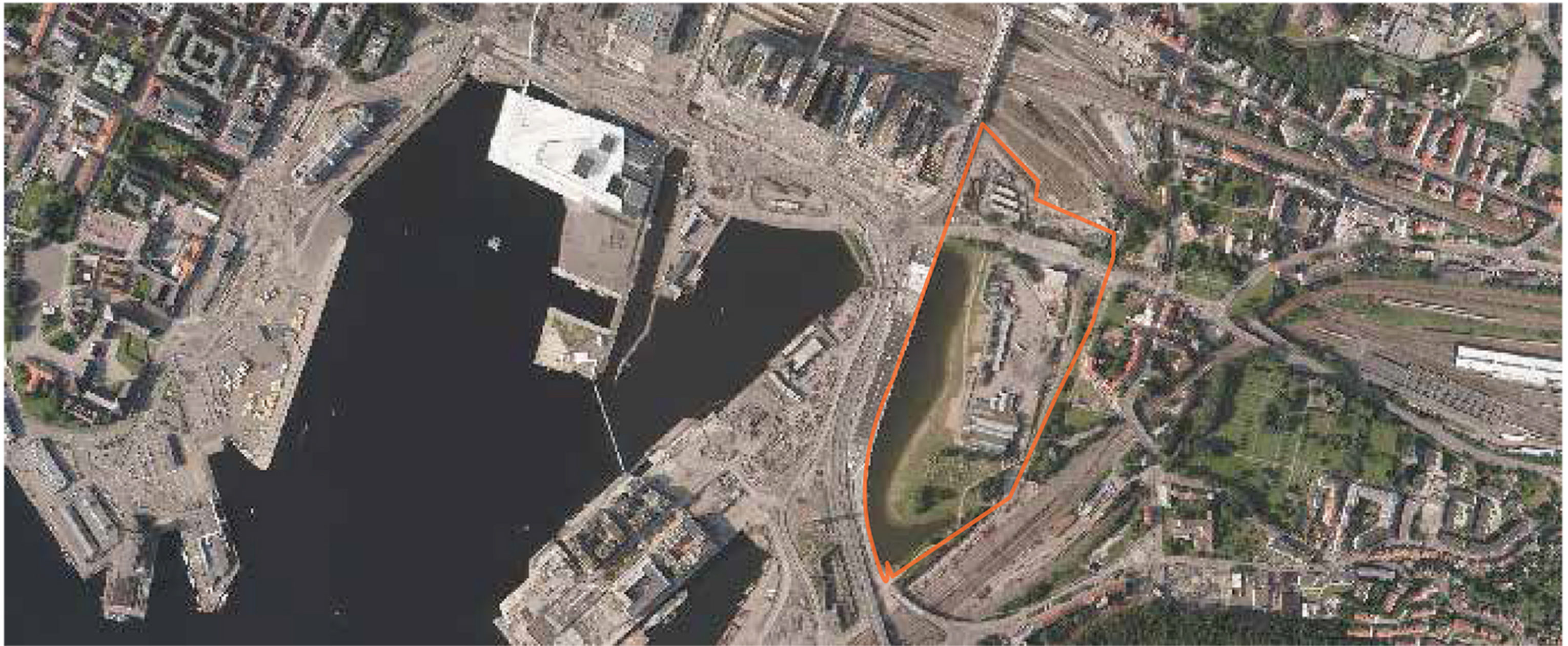
A. BJØRVIKA. La remodelació del front marítim d'Oslo va començar amb la construcció de la Òpera d'Oslo que va ser la primera pedra en recolzar tota la transformació urbana. El Barcode ja és una realitat en el nou boulevard d'Oslo que permetrà connectar el centre de la ciutat amb l'est de la ciutat històricament deixada de banda. El projecte es completarà amb la nova construcció d'habitatges i el futur del KHM museum.