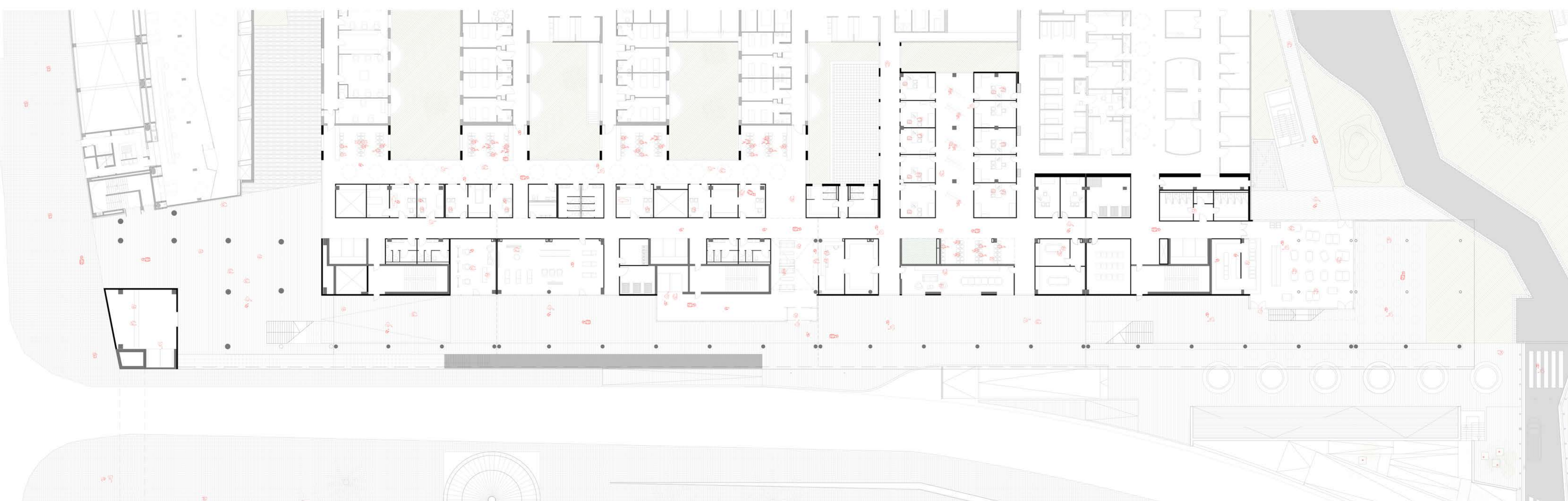
Planta Baixa_CONSULTES EXTERNES E 1:250