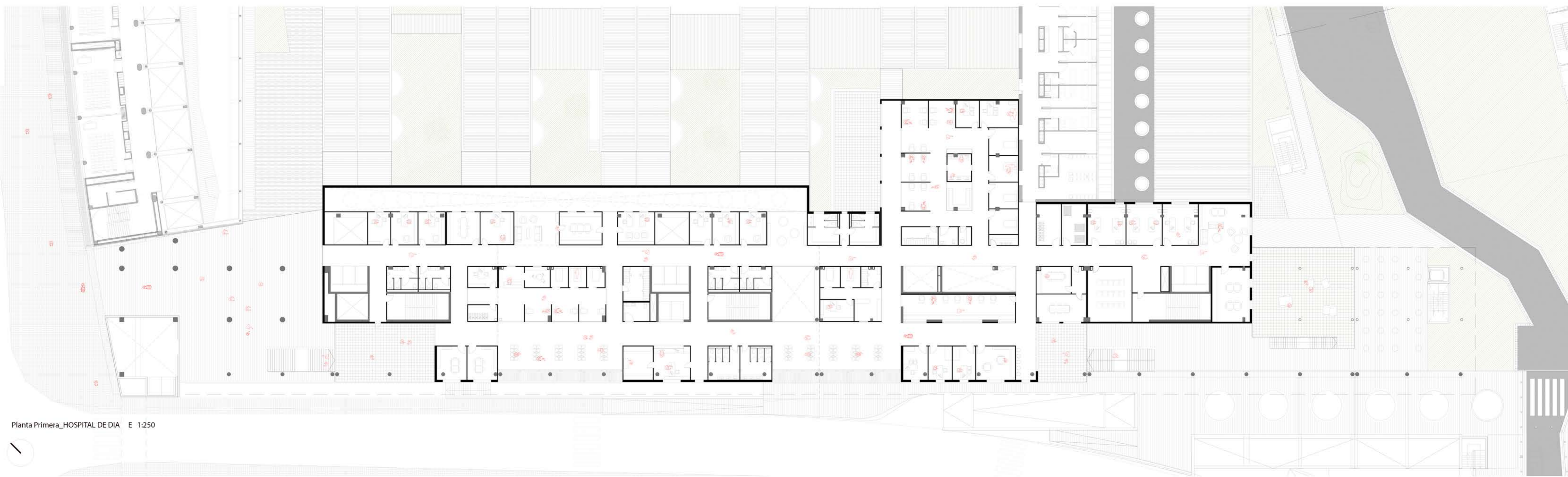
Planta Primera_HOSPITAL DE DIA E 1:250