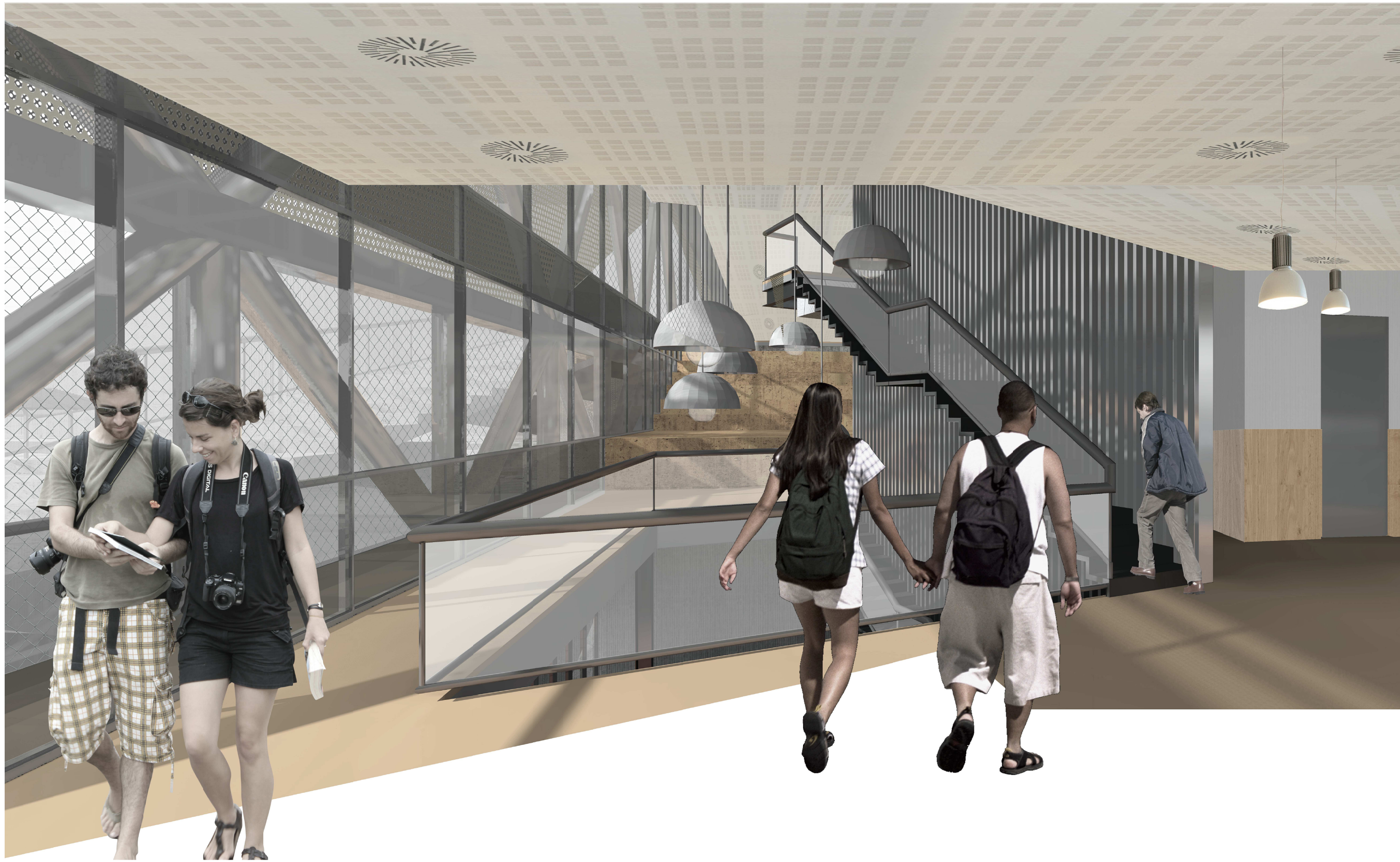
Vista vestibul edifici