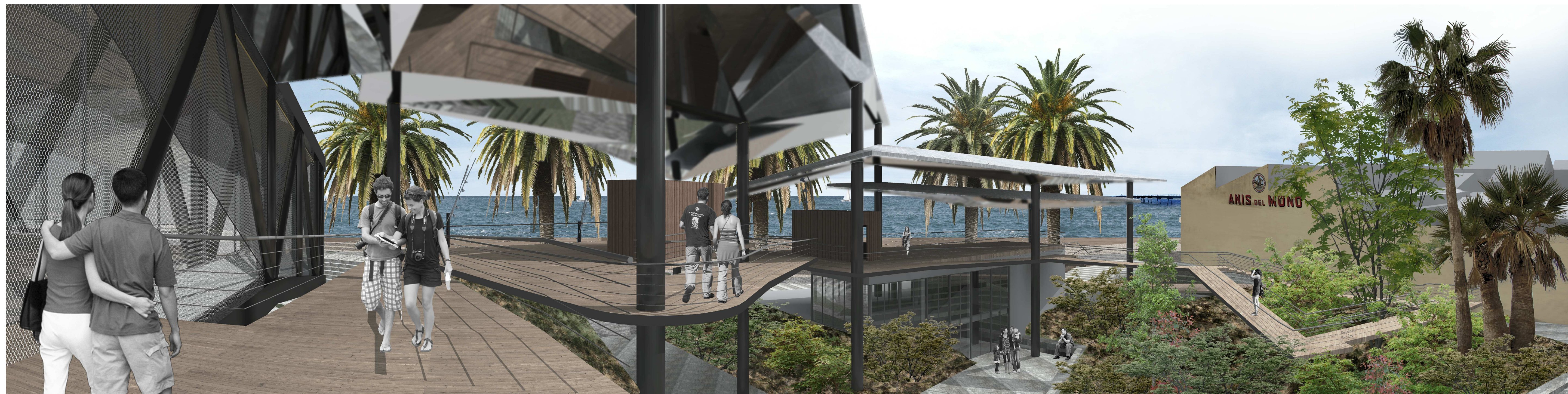
Vista rampes sortida edifici part mar