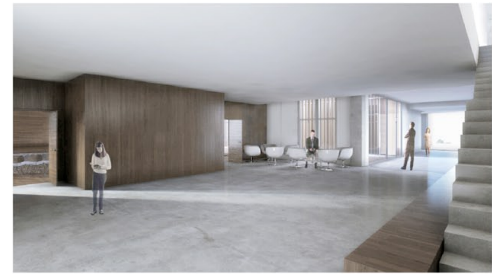
FOTOGRAFIA VESTÍBUL SALA POLIVALENT