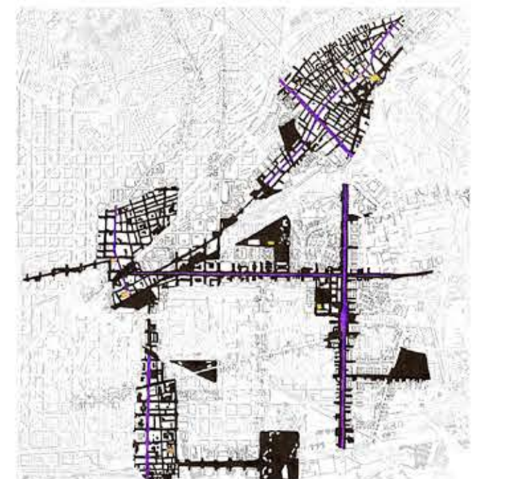
Teixit històric i vertebrador de St. Andreu-Sagrera-St. Martí

L'arribada del ferrocarril va ser un salt important pel desenvolupament i creixement de la ciutat, però una ferida urbana que encara avui viu la gent.