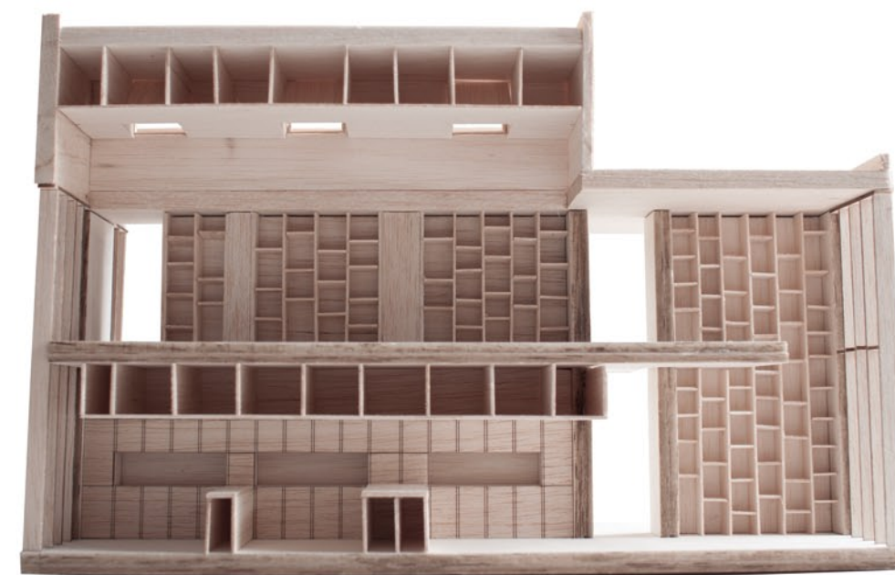
El laboratori i la biblioteca. El doble espai. Les entrades de llum