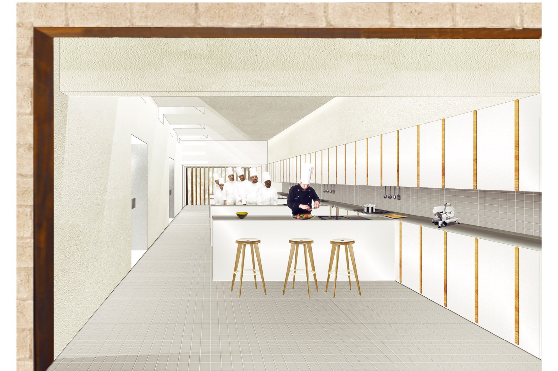
Vista interior dels tallers de planta primera.