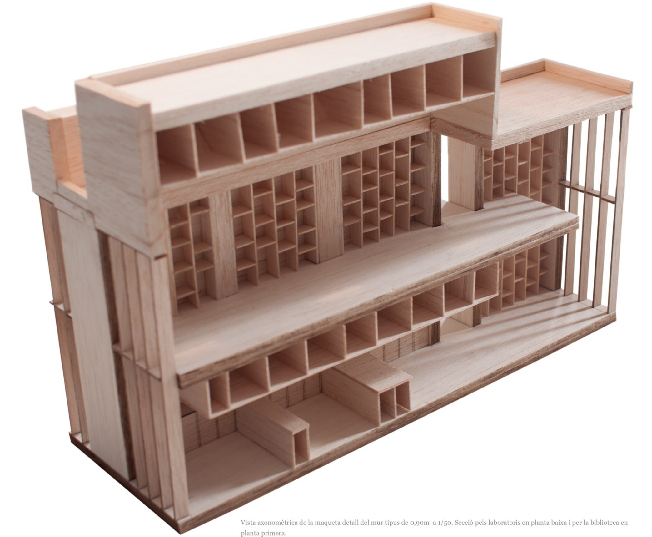
Vista axonòmica de la maqueta detall del mur tipus de 0,90m a 1/50. Secció pel laboratori en planta baixa i per la biblioteca en planta primera.