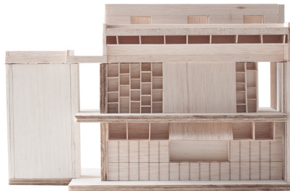
La modulació del mobiliari. El fals sostre.