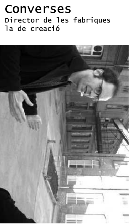
Converses Director de les fàbriques de creació